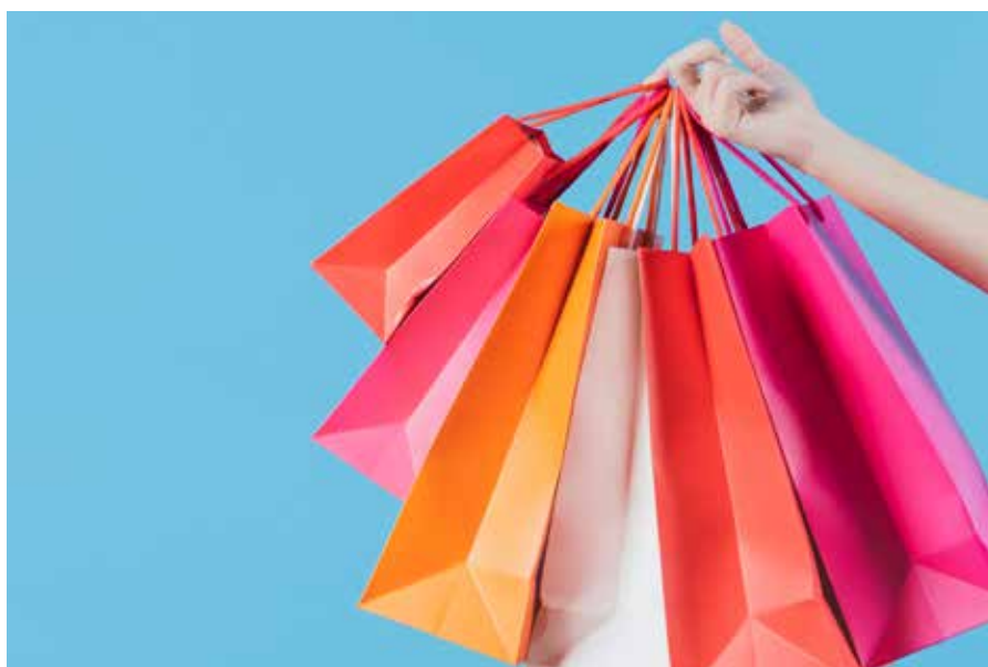
Erosi, erosi, barra barra! ▲

Eta errefrau edo atsotitzen bat edo beste momoriaz ikastea ere ez legoke gaizki, batez ere gure zaharrek oraindik ahoan edo oroimenean dituztenak.