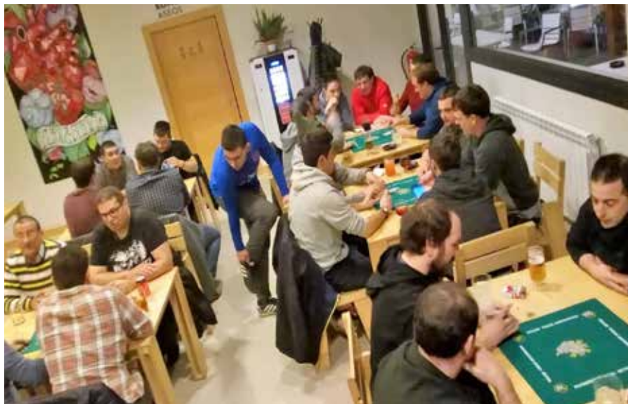
Aroztegin jokatuako kanporaketa ▲

Arabian izanen da aurtengo txapelketaren finala. Euskal Herri mailako irabazleendako sari bikainak izaten dira. Esaterako, txapeldunek 3.000 euro eta lau lagunendako nazioarteko bidaia irabaziko dute. Txapeldun ordeek, berriz, 1.500 euro eta bi lagunendako nazioarteko bidaia. Saririk irabazten ez dutenek ere aukera paregabea izanen dute egun polit bat pasatzeko, musaren aitzakian.