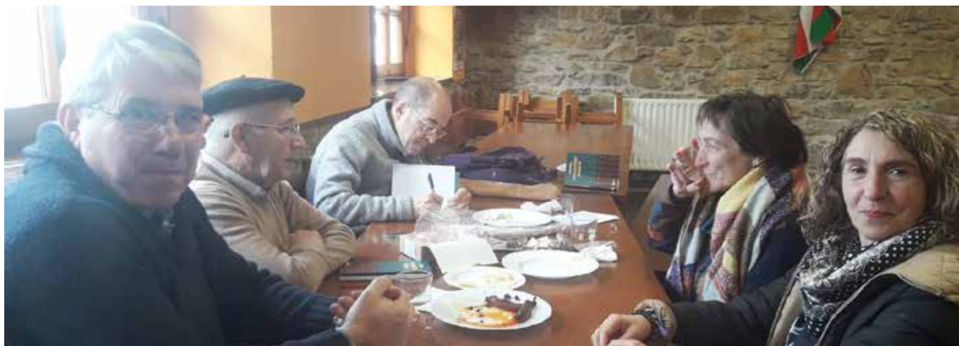
▲ Jan edanean gustura aritu ziren liburuaz hizketan