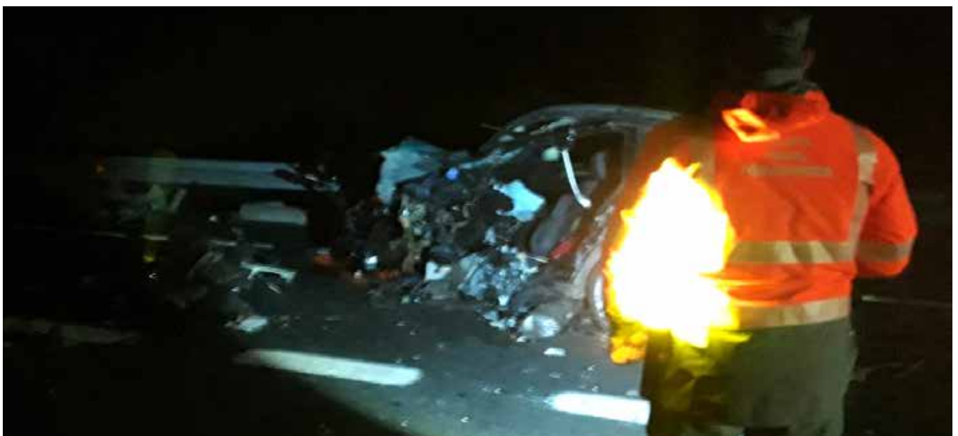
▲ Olague istripua

2019an 138 istripu izan dira errepide horretan, eta azken 3 urteetan, 15 hildako izan dira. 9.500 ibilgailu igarotzen dira egunero errepide horretatik, eta horien herena kamioiak dira.