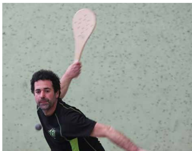
pala txapelketa iaz ▲

Gizonezkoak Paleta goma lehen maila 10 bikote Gizonezkoak Paleta goma bigarren maila 10 bikote Emakumezkoak frontenis 5 bikote