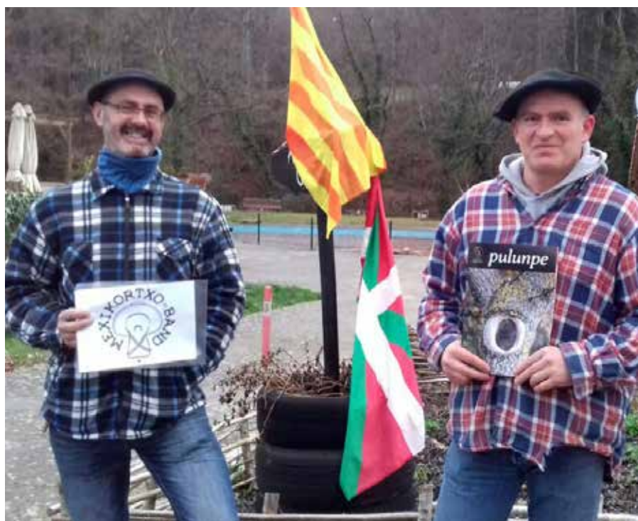
▲ Aizarozko banatzaile berriak dira Mexikortxotarrak

E: Bestetik, gainera, Pulunpen askotan ikusten ditugu eskualdeko euskaldun zaharrak, euskara mantendu dutenak, eta nik uste dut nolabait haiekin zorretan ere bagaudela, euskararen alde guk ere zerbait egin beharra dugula. Hona etorri gara eremu euskaldun batera, eta, beraz, zerbaitetan lagundu badezakegu, horrelako gauza txikia izanda ere, bada aurrera!