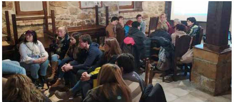
▲ Jende dezente hartu zuen parte lan saioan

Ultzamako Gizarte Zerbitzuen Mankomunitateak antolatu zuen hitzaldia, aurtengo Lizasoko festetan gertatu zen eraso sexistaren harira. Indarkeria matxistaren nondik norakoak azaldu eta gero, taldeetan banatuta indarkeria horri aurre egiteko estrategia eta baliabide indibidual, instituzional eta kolektiboak identifikatu ahal izan zituzten.