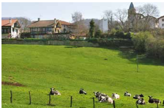
Iturria, anue.es ▲

Anueko gertaerarik eta ekimenenik ez galtzeko. Prest bazaude edo laguntzerik baduzu idatzi pulunpe@gmail.com helbide elektronikora. Aldez aurretik eskerrik asko!