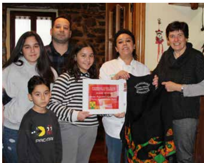
Igoako Ostatuko kideak sariarekin ▲

Zorionak irabazleei eta baita parte hartzaile guztiei, lan bikaina egin dute eta!