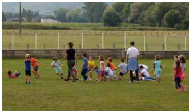
Haurrak Larraintzarko ikastetxean jostaketan ▲