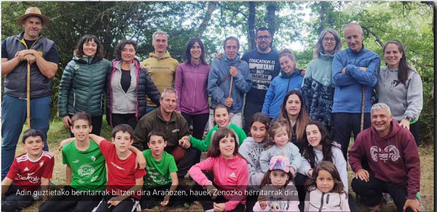
Adin guztietako herritarrak biltzen dira Arañozen, hauek Zenoizko herritarrak dira