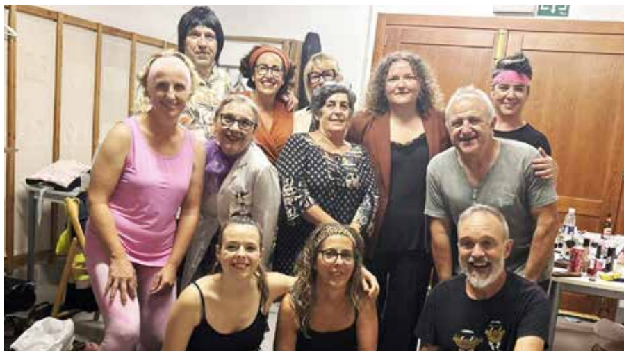
Axolagabekoak aurtengo antzezlanean, oholtzara atera baino lehen