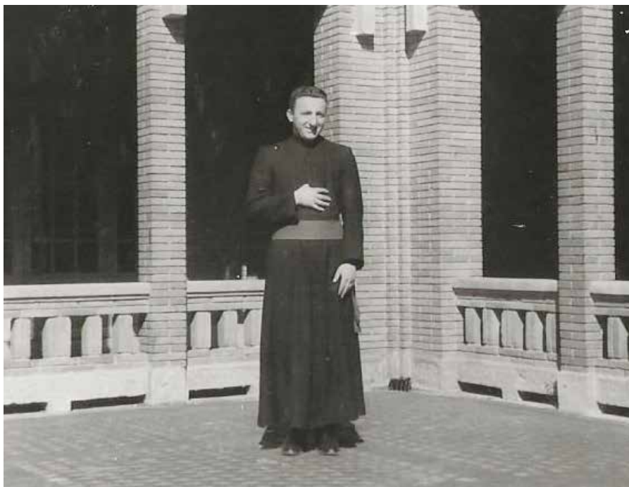
Seminarioan. Teologia ikasketak egiten, 22 urtetan. ▲