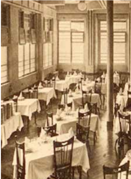
▲ Hotel El Rey Nobleko jantokia