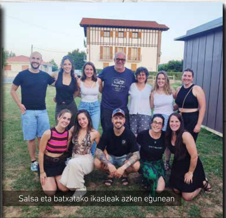
Salsa eta batxatako ikasleak azken egunean