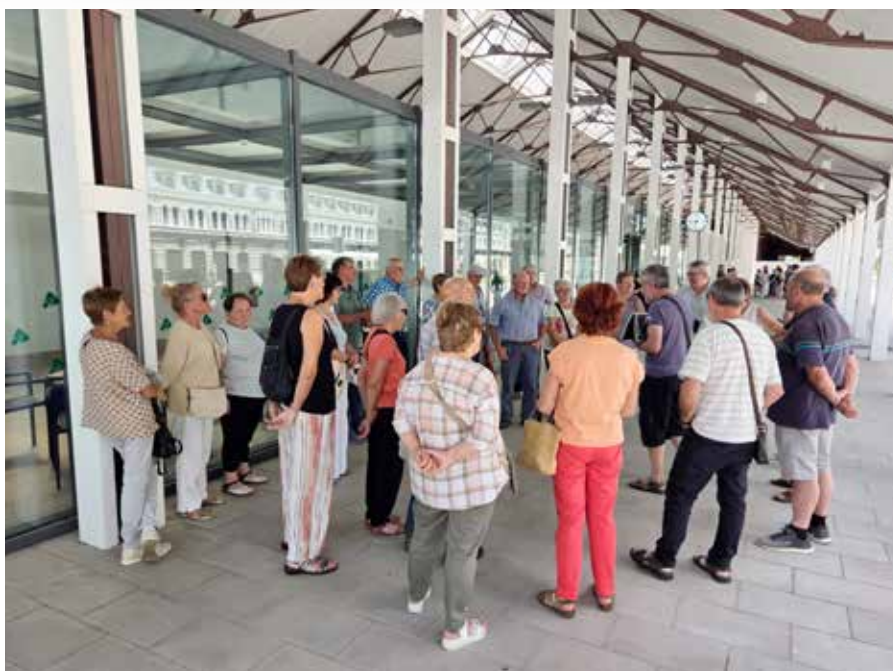
Itzaletik, tren geltokiko historia entzuten, argazki zaharrak ikusiz ▲

1928ko uztailaren 18an, Espainiako errege Alfontso XIII.ak eta Frantziako presidente Gaston Doumerguek Somporteko geltokia eta tunela inauguratu zituzten ofizialki, zazpi hamarkada baino gehiago iraun zuen ingeniari-tza-ahalegin handia burutuz. Eraikin nagusia estilo modernista eta klasiko frantseseko jau-