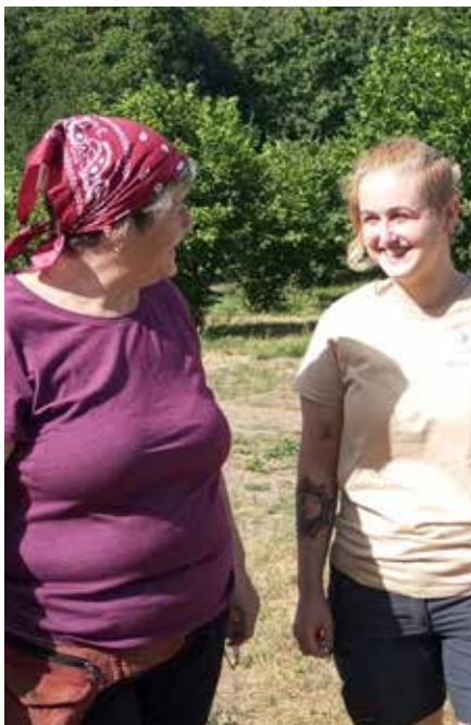
▲ hurrizten soroan