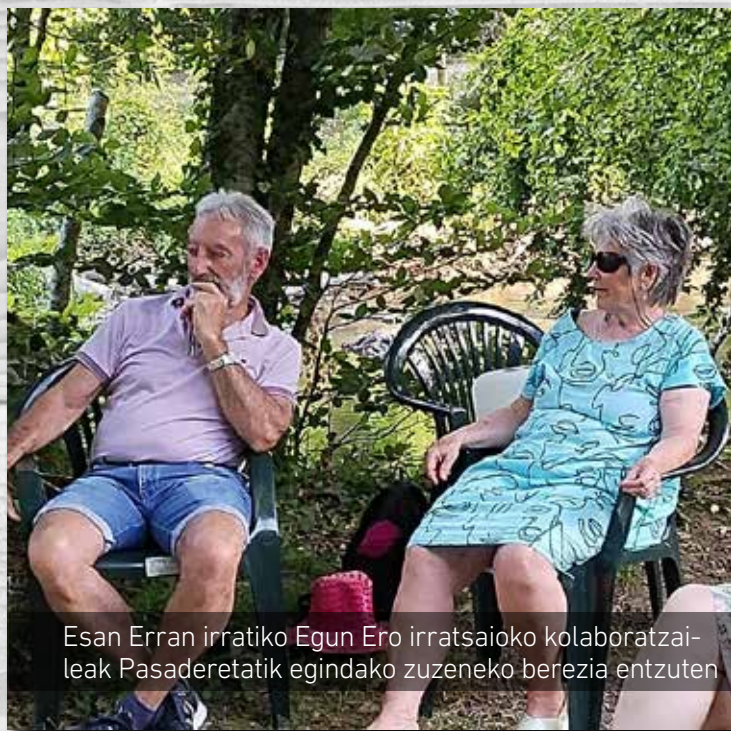
Esan Erran irratiako Egun Ero irratsaioako kolaboratzaileak Pasaderetatik egindako zuzeneko berezia entzuten