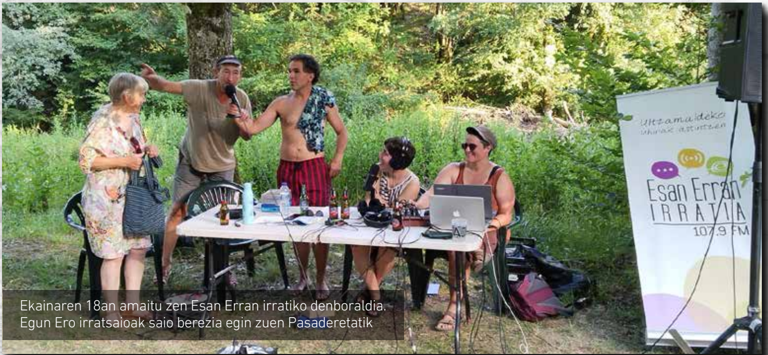
Ekainaren 18an amaitu zen Esan Erran irratiako denboraldia. Egun Ero irratsaioak saio berezia egin zuen Pasaderetatik