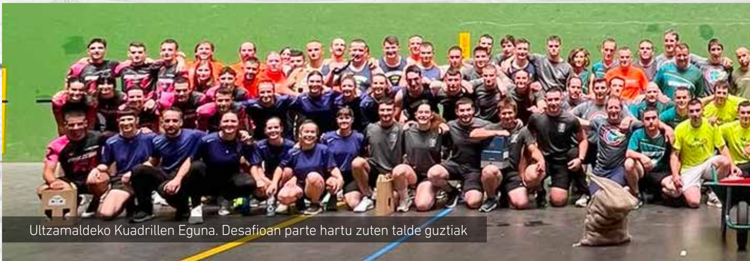
Ultzamaldekoko Kuadrillen Eguna. Desafioan parte hartu zuten talde guztiak