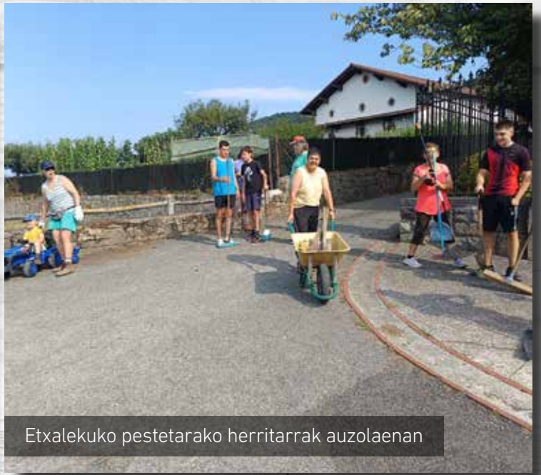
Etxalekuko pestetarako herritarrek auzolaenan