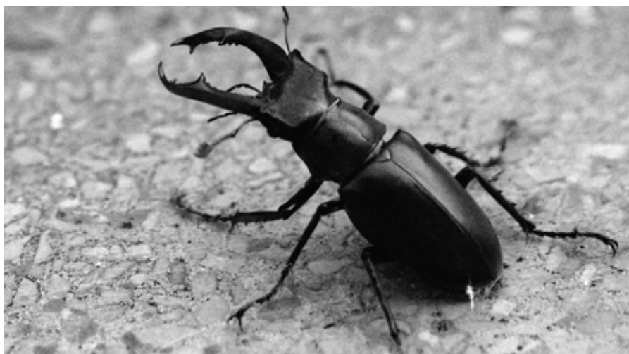
▲ Arkamelua edo akalamendia, Leitzan harrapatua.

Hildako zuhaitzen egurra basoan uztea garrantzitsua da, hori baita arkameluen habitata