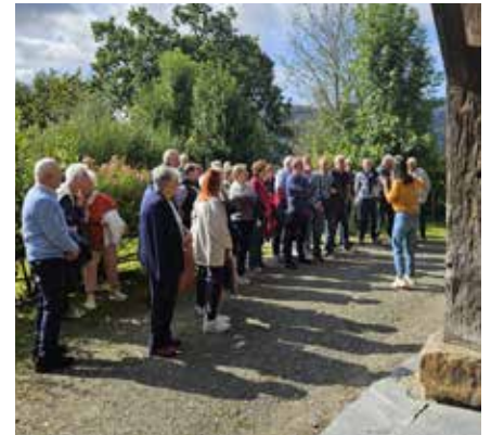
.. Sartu aurretik baserriaren istorioaz jabetzen .. ▲