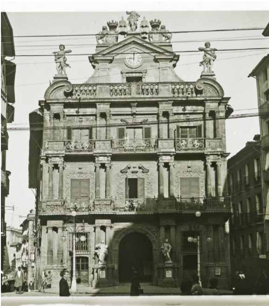
Iruñeko udaletxea 1930ean ▲