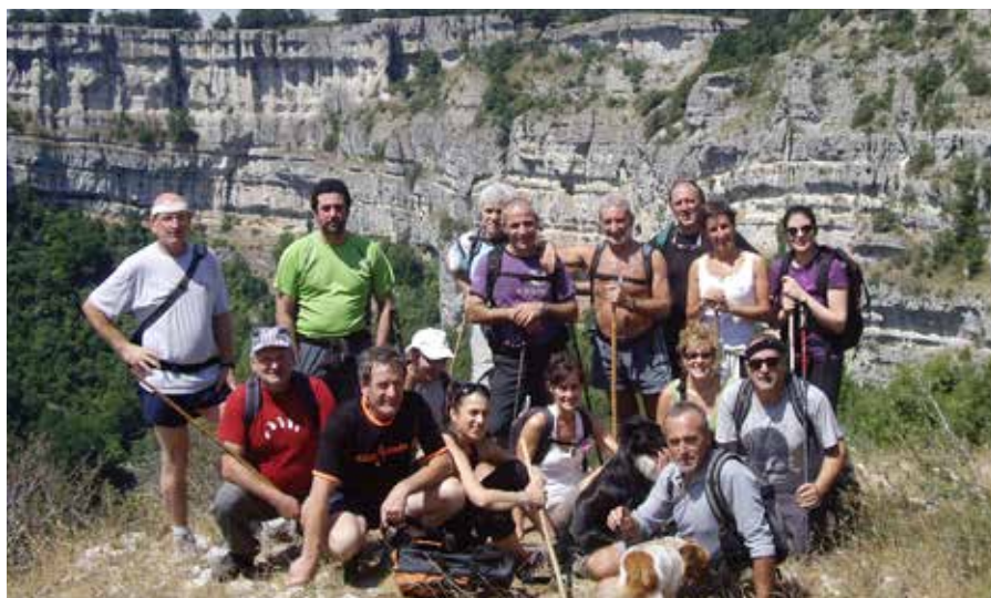
▲ Orbela taldea, 2012an, Urbasan

Askotan, autobusa dutenean, tarteko geldialdi alternatiboak ere jartzen dituzte, pertsona bakoitzak nondik hasi eta noraino egin nahi duen aukeratzeko. "Duela urte batzuk, Ultzamako Bentatik Sorogainera igo ginen, baina autobusarekin geundenez, hiru aukera jarri genituen: Belaten zen lehen geldialdia, Artesiagan bigarrena, eta Urkiagan azkena". Parte-hartzaileek erabaki zezaketen nondik atera eta noraino egin nahi zuten, autobusaren geldialdiak aprobetxatuta.