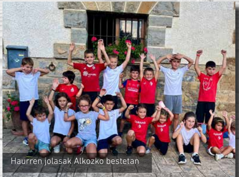
Haurren jolasak Alkozko bestetan