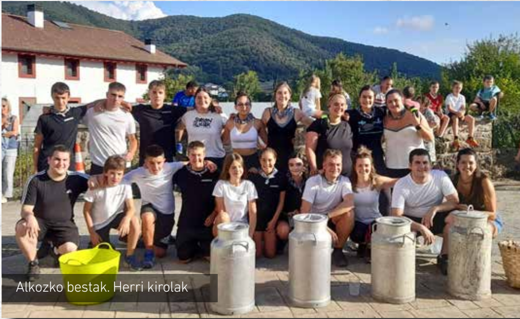
Alkozko bestak. Herri kirolak