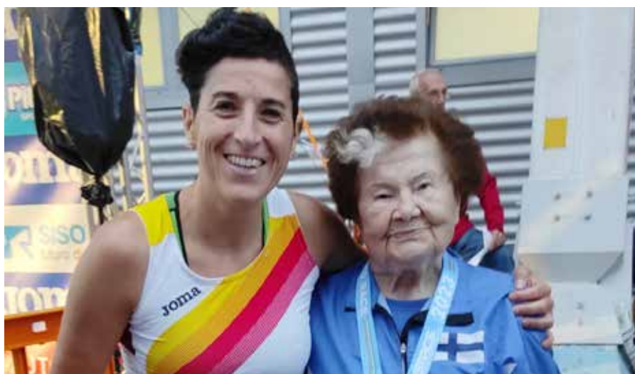
▲ Europako pisu jaurtiketako txapelkunak 100 urte baino gehiago ditu

Bai (irriak) hori guztiok esten dugu. Kirola oso-oso inportantea da niretako eta osasunak aukera ematen baldin badit hil arte egingen dut. Masterretan 60, 70, eta 100 urteko jendea ere ikusten duzu! Niretako izugarria da. Badut argazki bat pisu jaurtiketako Europako txapelkunarekin, Estoniakoa da, eta 100 urte baino gehiago ditu!