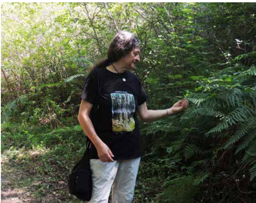
Sendabelarrentzat inguru paregabea bizi garela dio Gurbindok ▲

Bai, baina lan gutxi egiten dut gaur egun. Bere garaian, Iruñeko udaletik proposatu zidaten ikastaroak ematen hastea, eta orduan hasi nintzen formalki honetan lanean. Segituan, beste herri batzuetatik ere deika hasi zitzaizkidan. EHNE sindikatuarekin ere urteak egin ditut lanean, Hego Euskal Herri osotik mugitzen nintzen ikastaroak ematera. Garai batean, ikastaro asko diruz laguntzen zituzten, eta, orduan, azkar betetzen ziren. Baina, krisia eta gero murrizketak egon ziren, gaur egun ikastaroak norbere dirutik ordaintzen dira, eta jende gutxiago animatzen da.