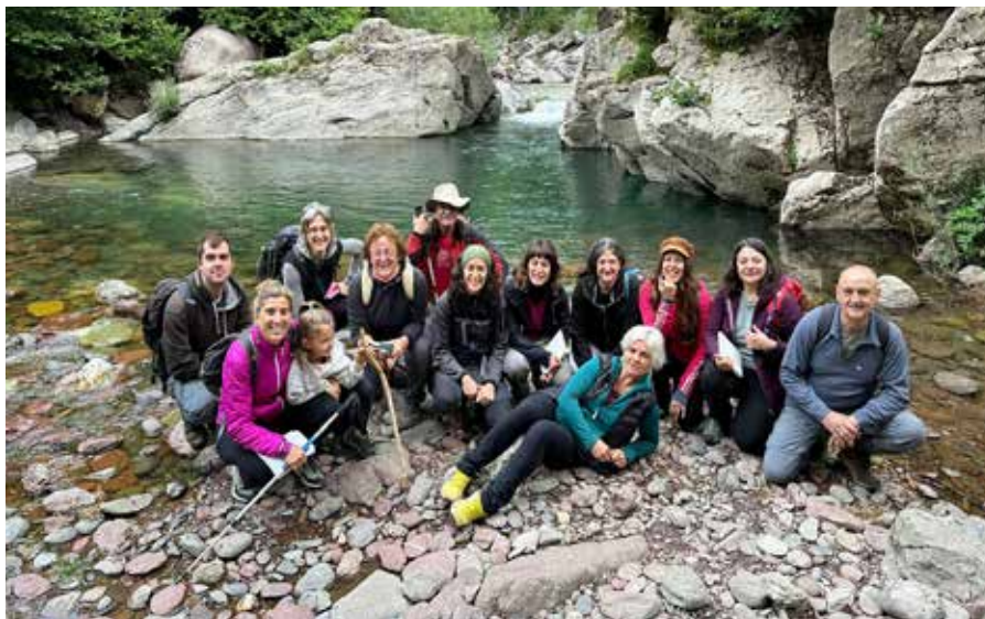
▲ Hego Euskal Herri osoan eman izan ditu ikastaroak Gurbindok

Sendabelarren ikastaroak ez ezik, onddo eta zizen ingurukoak ere urtero antolatzen ditu Gurbindok. Gorosti zientzia elkartearekin ikasi du onddo eta zizen inguruan, eta hastapeneko ikastaroak eskaintzen ditu. Udazken honetan, esaterako, Larraintzarren eta Irurtzunen emanen ditu klaseak.