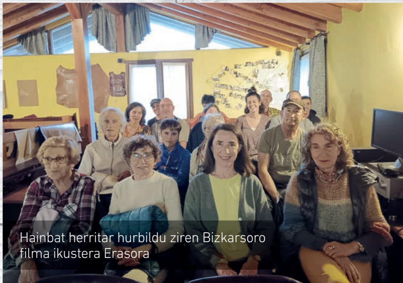
Hainbat herritar hurbildu ziren Bizkarsoro filma ikustera Erasora