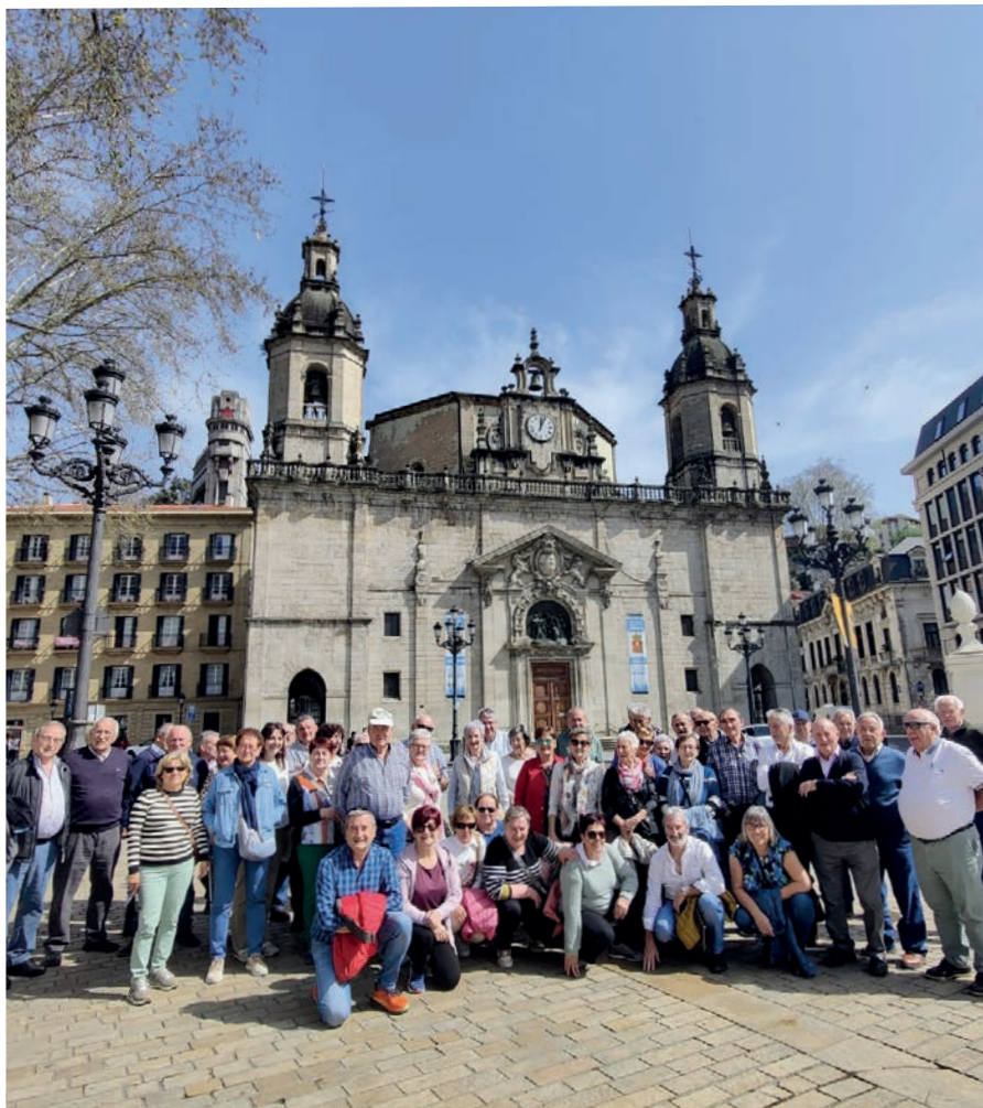
Areatzako parkean, atzean San Nikolas eliza dagoela. ▲

Autobusak aurrera egin zuen Begoñaraino, han jaitsi eta geldialdi bat egin genuen basilika ikusteko. Urteen joan etorrian hainbat kalte jasandako basilika dela esan ziguten gidek, batez ere guda karlistetan. Hain zuzen ere, inguruan zauritu zuten Zumalakarregi, eta, horren ondorioz hil egin zenez, gerra galtzea ekarri zien karlistei. Bilboko sarrera garrantzitsuena zen Begoña eta hori kontrolatu nahiak gudak sortzen zituen inguruan eta kalteak basilikan.