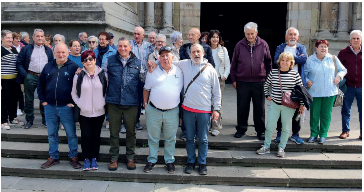
▲ Begoviako basilikara sartu-atera egin ondoren.