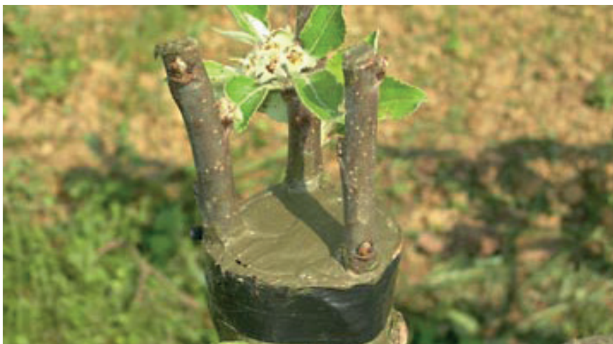
txertaketa egina, hiru mentu oin batean

Txertaketaren gauzarik garrantzitsuenak elkartzen diren bi landareen izerdiak bat egitea da, alegia, oinetik izerdiak gora egiten duenean, goian txertatzen den landarera izerdia ongi iristea. Formaren arabera, mentu bidezko txertaketa mota desberdinak daude: azalekoa, zubierakoa, eskudetea, ezpala, ingelesa, omega (makinarekin egina), zaldiena, albokoa, arrakala edo txapa.