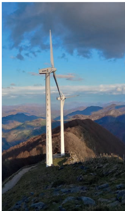
Berueteko haize errotak ▲

Azkenean, 4,99MW-ko bost parke planteatu dituzte txostenetan, beraz, guztira, 24,95MW-ko parke batez