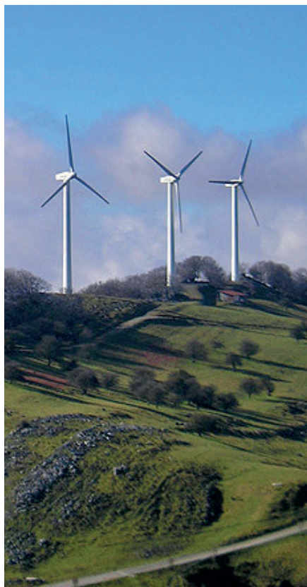
Haize errota Aritz mendian, Leitzan

Proiektuak kezka eta interesa sortu du Imozko eta Basaburuko herritarren partetik. Otsailaren 16an hitzaldi informatiboa antolatu zuen eskualdeko herritar talde batek, proiektuaren inguruko xehetasunak biltzeko eta aurkezteko helburuarekin. Sustrai Erakuntza elkarteko kideak ere izan ziren bertan, Nafarroan energia berriztagarrien bueltan gertatzen ari diren mugimenduak testuinguruan kokatzeko helburuarekin. Horrez gain, Basaburuko eta Imozko udalek ere parte hartu zuten hitzaldian. 70 bat lagun elkartu ziren lehen hitzordu hartan, eta herritar talde batek gaia lantzen segitzeko asmoa ere erakutsi du.