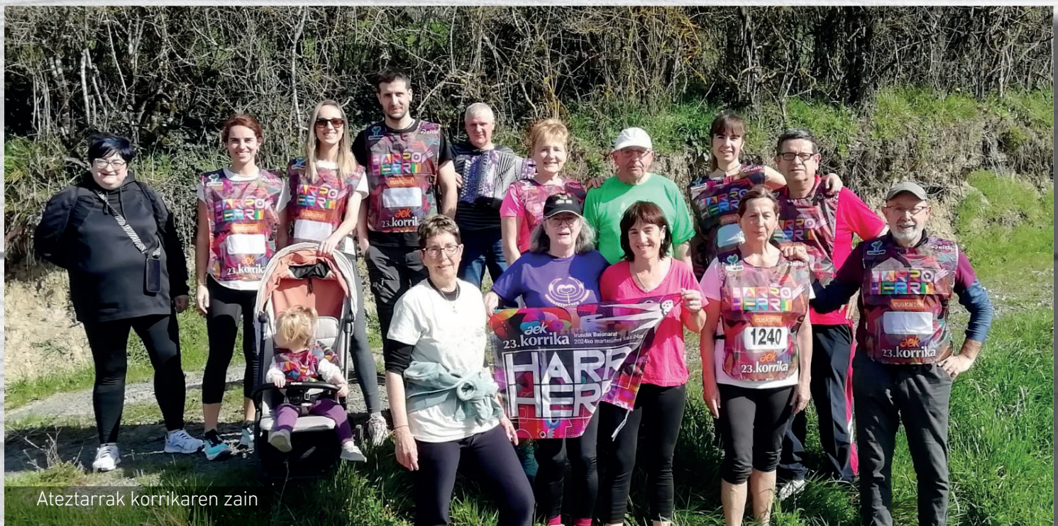
Ateztarak korrikaren zain