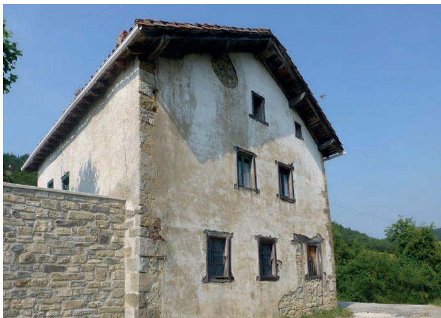
▲ Etsaingo eskola zaharra

Zipla/ziple: indirecta mordaz. Hemen ere ibiltzen dugu hitz hau.