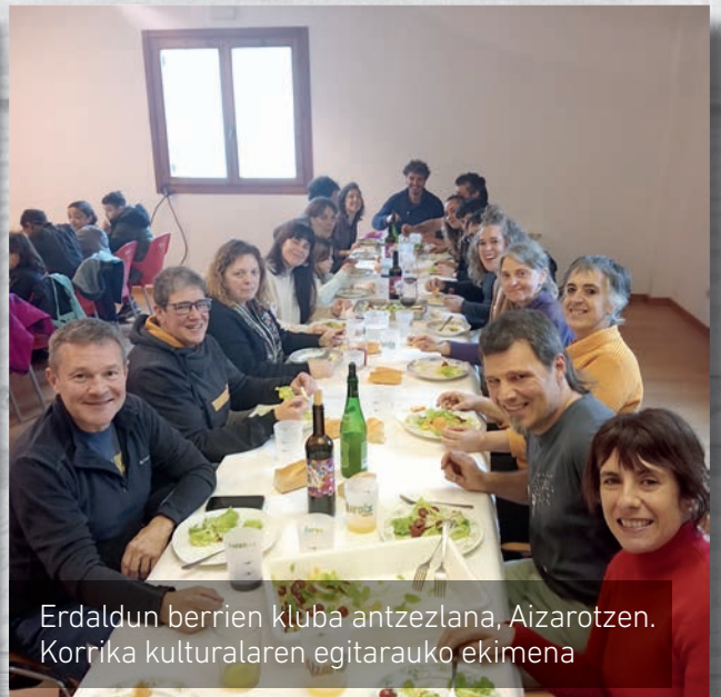
Erdaldun berrien kluba antzezlan, Aizarotzen. Korrika kulturalaren egitarauko ekimena