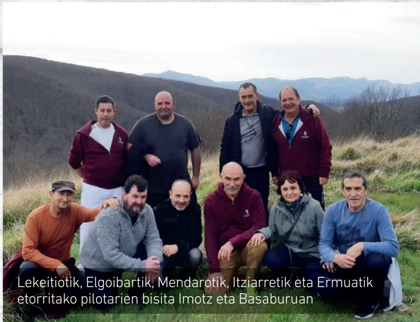
Lekeitiotik, Elgoibartik, Mendarotik, Itzietatik eta Ermuatik etorritako pilotarien bisita Imotz eta Basaburuan