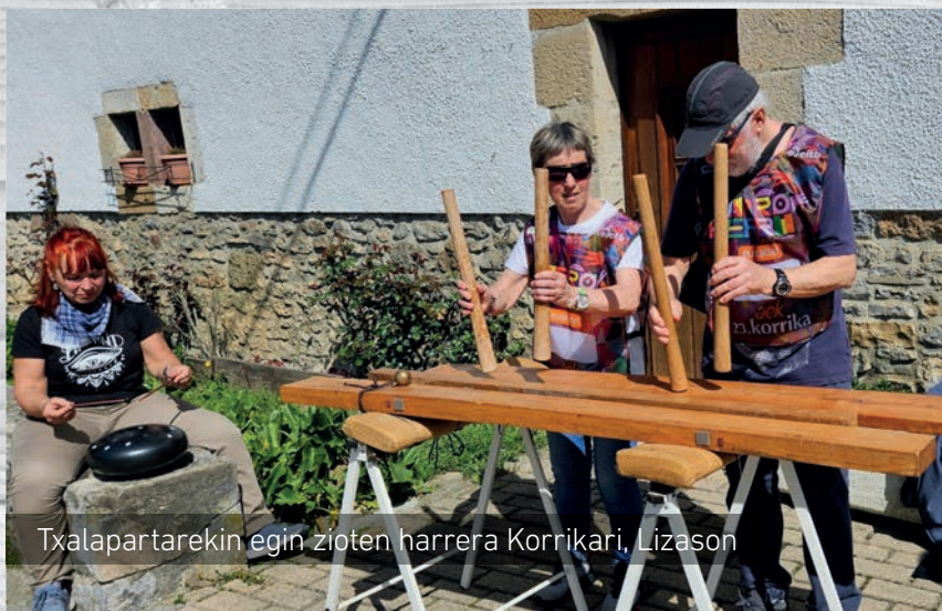
Txalapartarekin egin zioten harrera Korrikari, Lizason