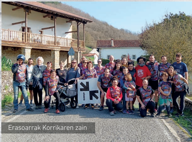
Erasoarrak Korrikaren zain