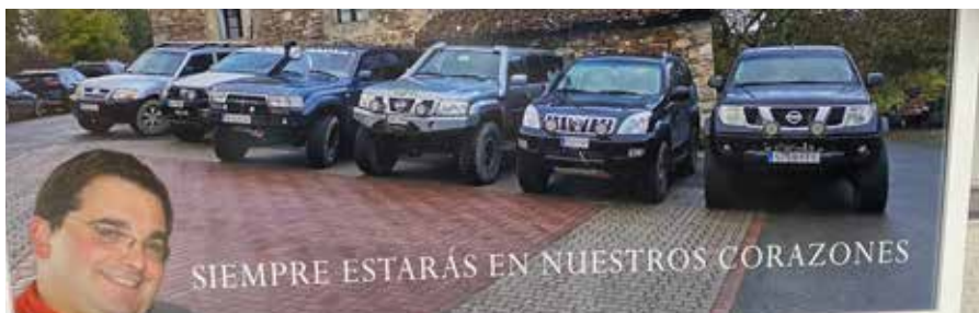
▲ Adiskide minak eta autozaleak egin dioten oroigarria, bihotz bihotzez.

Atsekabean lagun Antsoneko eta Errandoneko familei.