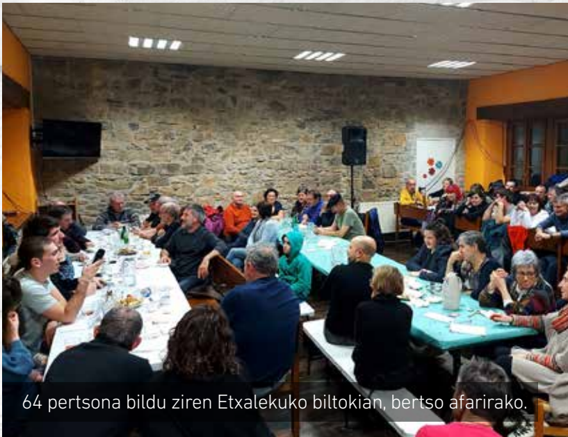
64 pertsona bildu ziren Etxalekuko biltokian, bertso afarirako.