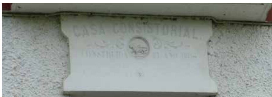
▲ Casa Consistorial. Construida el año 1894

Eta dirua zela eta, Diputazioari baimena eskatzea erabaki zen, 15.898,83 pza.ko diru hartze bat egiteko.