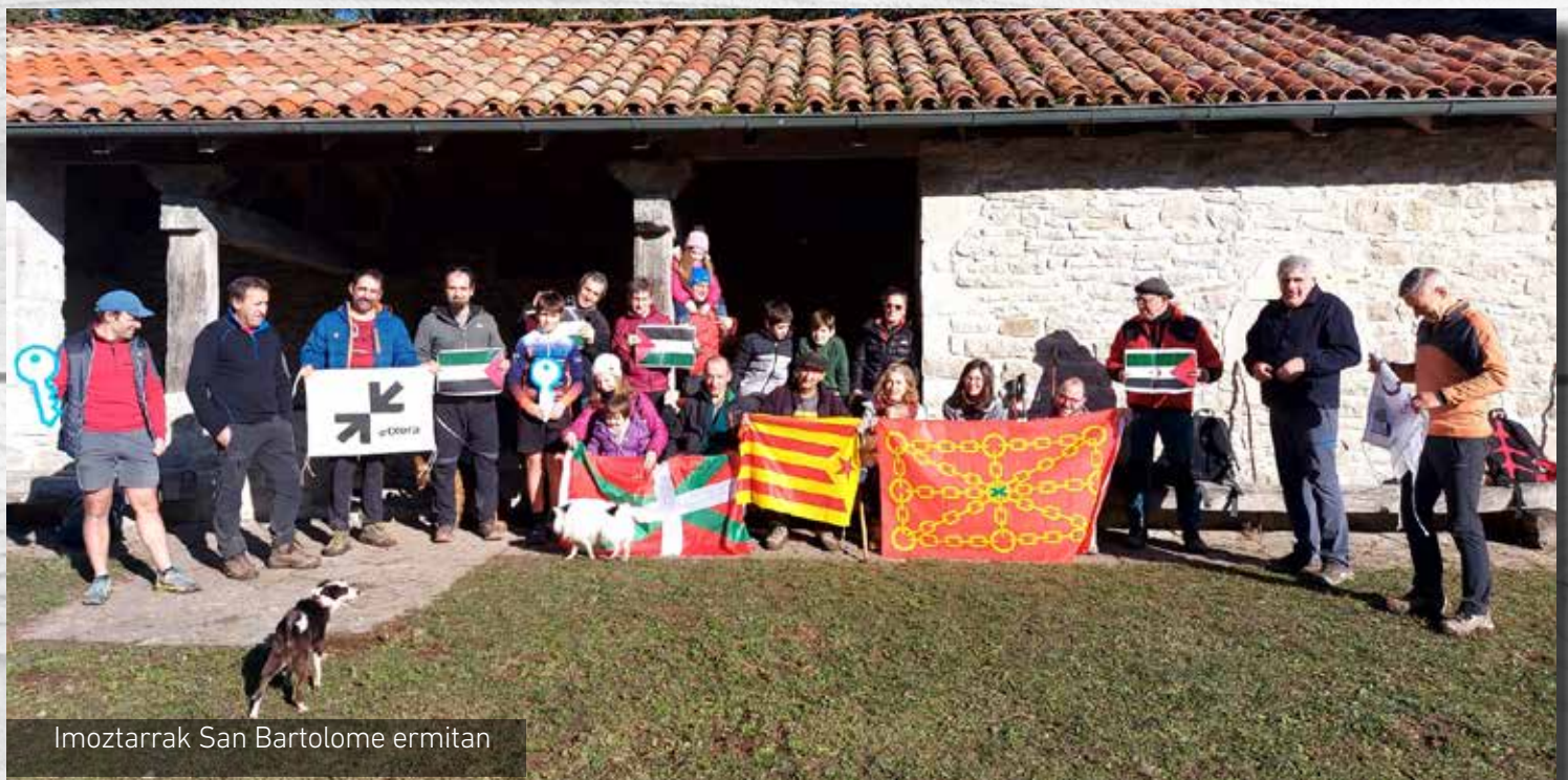
Imoztarrak San Bartolome ermitan