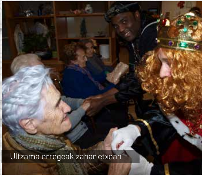
Ultzama erregeak zahar etxean