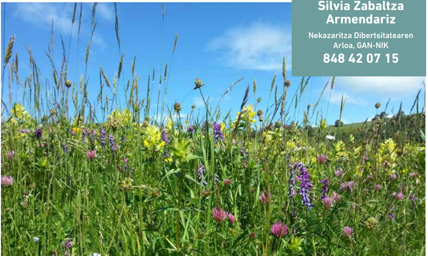
▲ Beste sega belar bat Belaguan. Silvia Zabaltza (GAN-NIK)