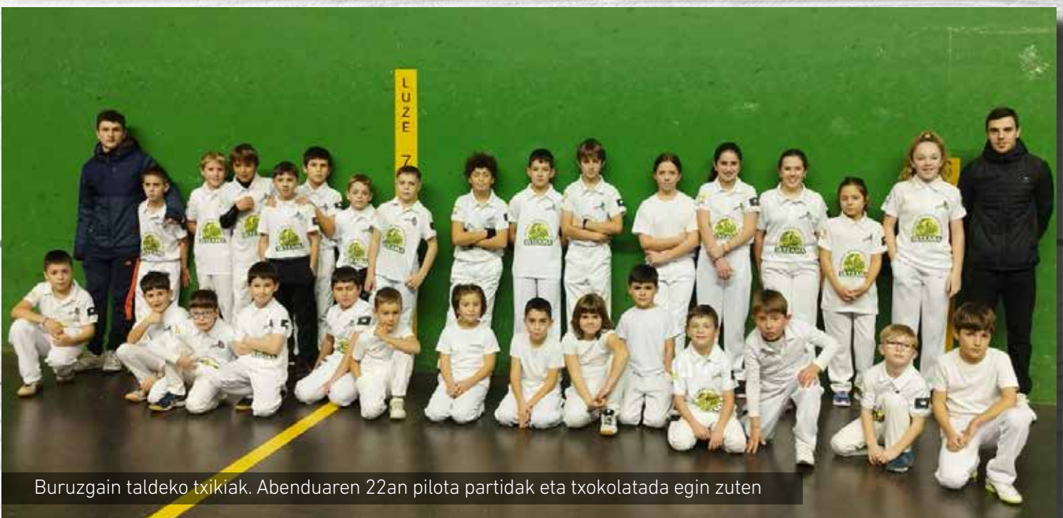
Buruzgain taldeko txikiak. Abenduaren 22an pilota partidak eta txokolatada egin zuten