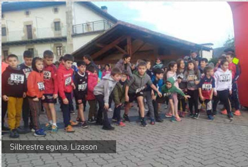
Silbrestre eguna, Lizason