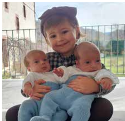
▲ Aitana bizkor dago, badezake bi anaittoekin