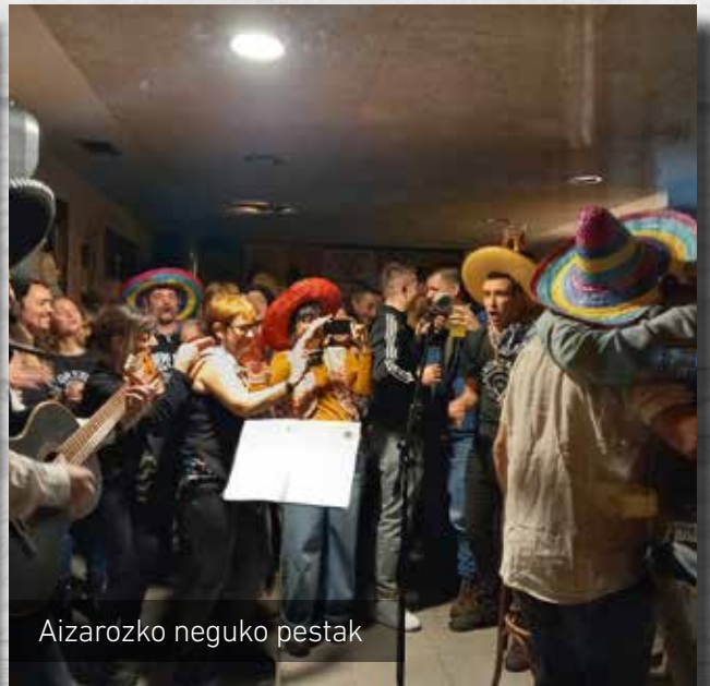
Aizarozko neguko pestak