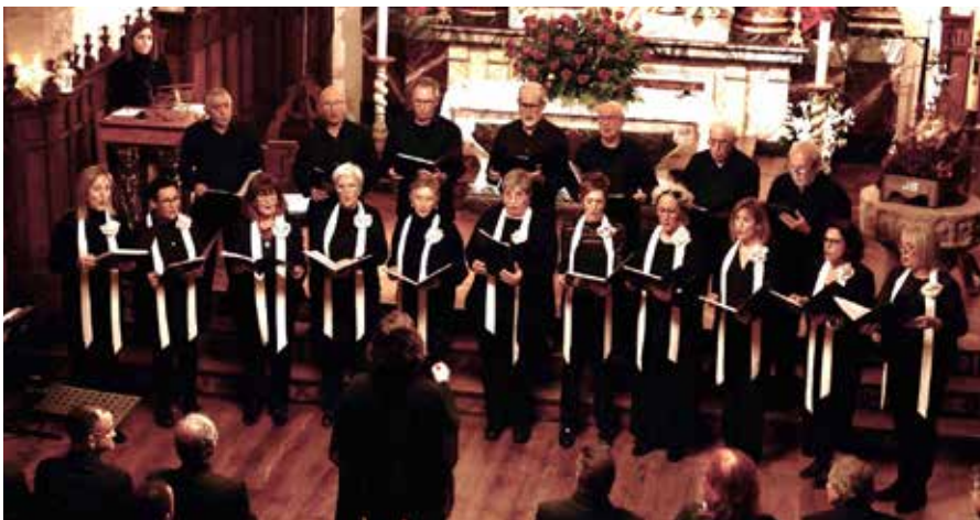
▲ AMATI ABESBATZA IRAIZOTZEN 23-12-29