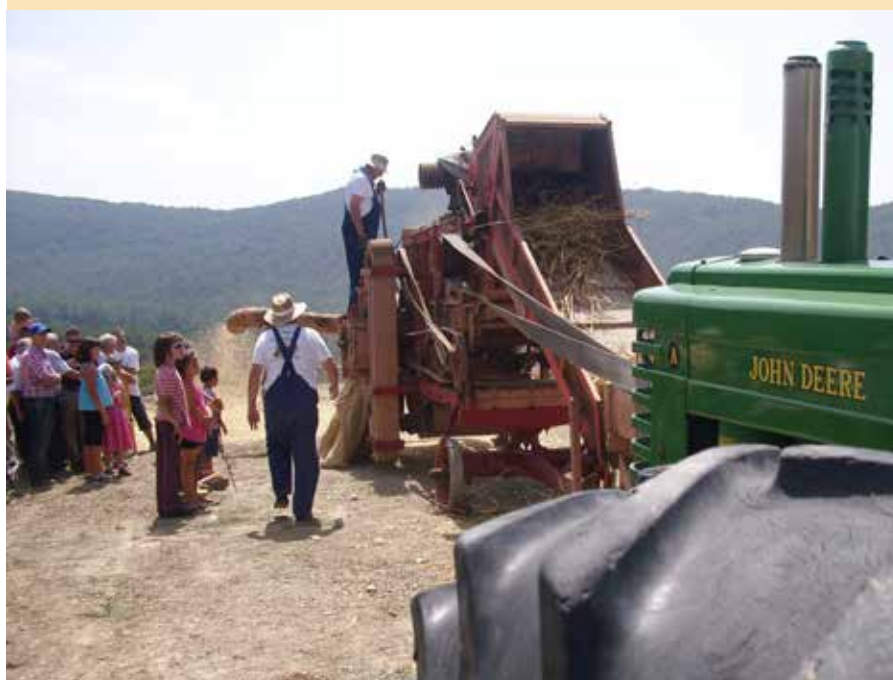
▲ 2012ko pestetan martxan jarri zuten erakustaldi gisa