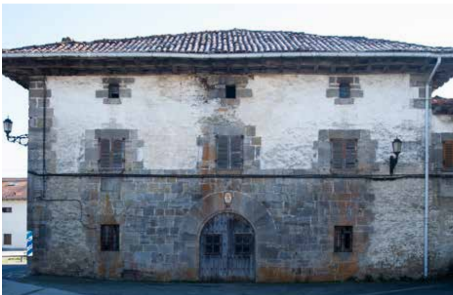
▲ Ustez behintzat, fatxada printzipala

Valdonsella: Valdonsella berez Aragoiko ibar bat da 6 bat herri dituena, baina hemen lurralde handiago batez ari gara, Iruñeko Apezpikuaren mende eta 40 herri hartzen zituenaz, alegia. 1785. urtean Iruñeko Apezpikuaren eskuetatik Jakako eta Huescako Apezpikuetara pasatu ziren.