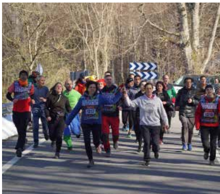
Berute izan zen Korrikak gure eskualdean igaro zuen azken herria