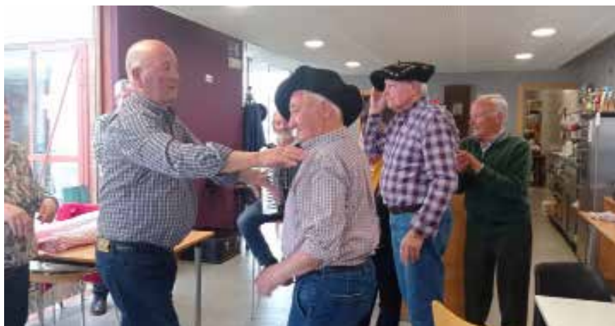
▲ Hirugarrenak lehenengoei txapela ematerakoan