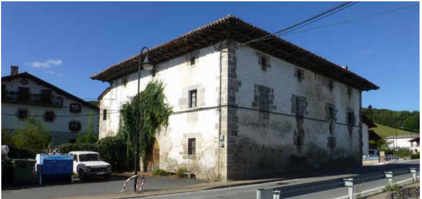
Ez, zinez, ez da nolanhiko etxea ▲

Hemengo hau dugu Auzako Bengoetxea, herriko beheitieneko etxea baita. XVII. mendearen hasieran bertako jabeak Bengoetxea zuten deitura. Aurki etxearen izenetik etorriko zitzaien, garai haietan ohitura handia baitzen etxearen izenetik deitura hartzea. Ondoren Beratsain, Zenotz eta Larunbe deiturak etorriko ziren.