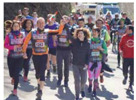
Basaburuko udaletxeko langileak ▲