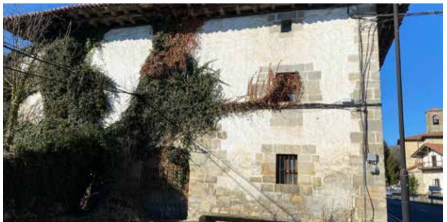
Untzak hartzen ari da. Laster fatxada guziaz jabetuko da ▲

Gehiago jakin nahi duenak entzun beza horretarako egin dudan audioa, amezti.eus-en aurkituko du edo telefono mugikorrarekin Pulunpen bertan QR delakoa klikatuta.