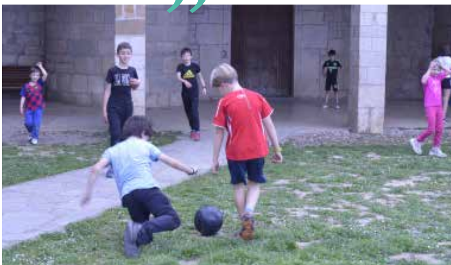
Herriko haurrak eta Ukrainiatik etorritakoak jolasean

Ostegunarekin hasi eta igandearekin bukatu zituzten