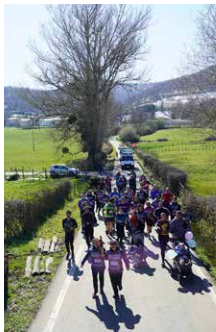
Larraitzarren batu zen jende gehien