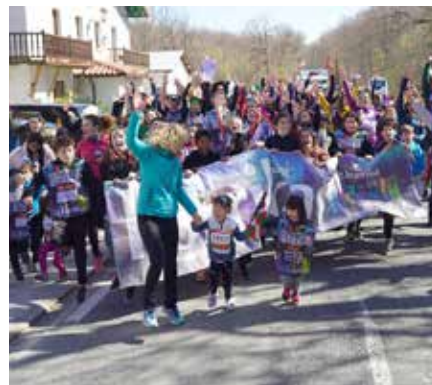
Ttikiena haur eskolak eta oi hanzabal eskolak hartutako kilometroan, Jauntsaratsen