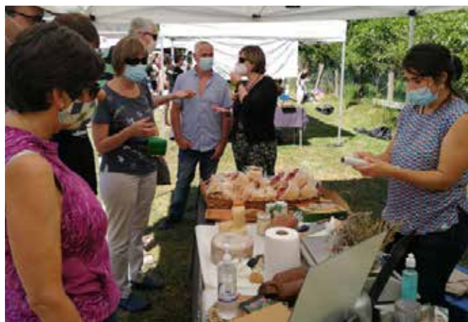
▲ Iazko azoka, Betelun