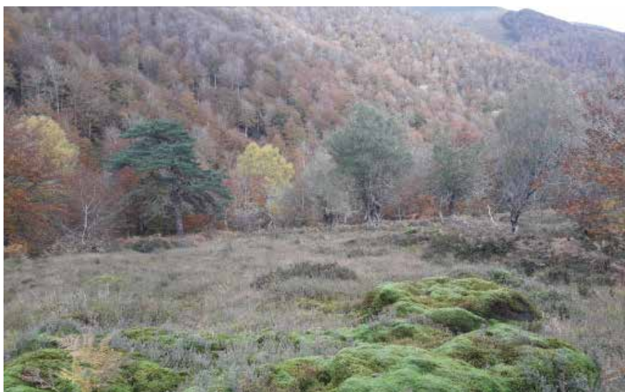
Urrabiako zohikaztegiako landaredia ▲