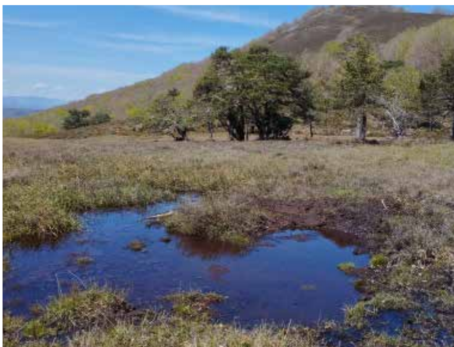
Gesaletako zohikaztegia eta, atzean, Artzeki mendia ▲