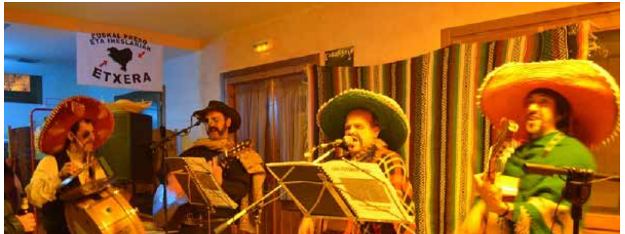
▲ Mexikortxoren hasiera, 2011n Aizarotzen