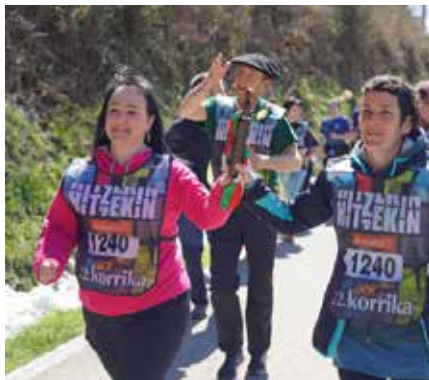
Imotzek hartutako kilometroa, aldapan gora, Berueterako bidean