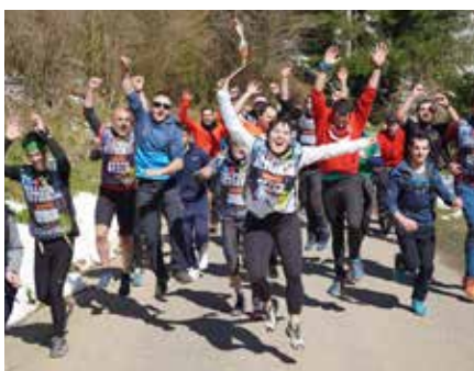
Aldapan behera edo aldapan gora, beti pozik ▲