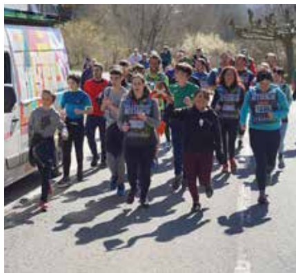
Apeztegi berriko tarbenak hartutako kilometroan ▲