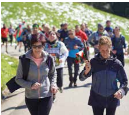
Berute izan zen Korrikak gure eskualdean igaro zuen azken herria