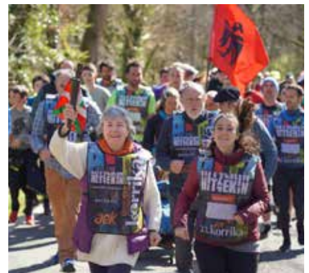
Atetzek hartutako kilometroa, Ilarregirako bidean ▲