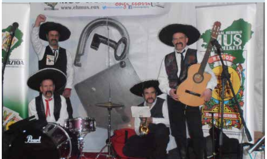
▲ Bigarren faseko kideak, 2017an Tuteran, EHko Mus Txapelketako finalean

2021eko abenduaren 26an festa egun berezia zuten prestatua Mexikortxotarrek Aizarotzen, 10. urteurrena behar bezala ospatzeko, bidelagun izandako guztiekin batera. Koronabirusak ez zien egun hartan ospatzen utzi azkenean, eta horregatik, hilabete batzuetako atzerapenarekin iritsi zen ospakizun festa. Apirilaren 15ean antolatu zuten ekimena: bokatada eta kontzertua izan zituzten, eta DJ Bullek luzatu zuen ondoren gaua. Mexikortxoren hamargarrena ospatuta, datozen urteetan beste zenbait urteurren izanen dira: Kubakortxo, Runbakortxo... Izan ere, Mexikortxoren lehen agerraldi horren ondorengo urteetan, herriko festetan beste musika estilo batzuk hartuta kontzertua eskaintzen jarraitu zuten kideek.