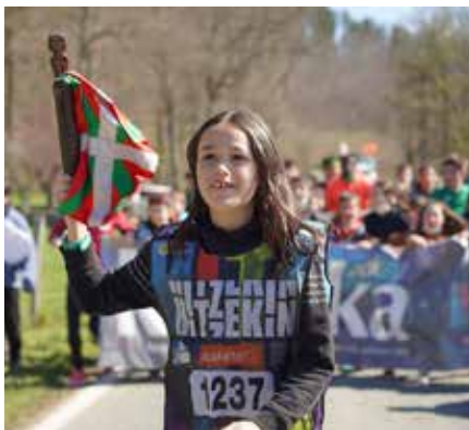
Adin guztietako herritarrek hartu zuten lekukoa ▲

Almandoztik heldu zen, Arraitzerako bidean, eta Alkotz, Iraizotz, Larraintzar, Auza, Erbiti, Gartzaron, Jauntsarats eta Beruete igaro zituen. 30 kilometro horietan 44 erakundek zituzten kilometroak erosiak; herri talde, kontzeju, udal nahiz enpresak tartean. Furgonetatik Leire Etxeberría iraziozarrak animatu zituen lasterkariak.