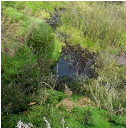
Urrabiako zohikaztegia ▲

Anuen zohikaztegi batzuk daude: Gurbaitz, Urrabia... baina ezagunenak Gesaleta eta Xuriain dira.