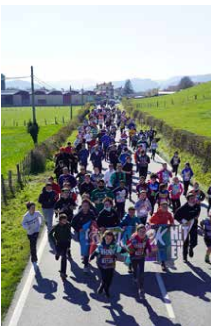
Eguraldi ederra egin du eta Ultzamaldeko irudi ederrak utzi dizkigu Korrikak