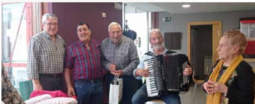
▲ Bigarrenak pozez kantari!!

Urte hasieran 332 bazkide ginen elkartearen: 176 Ultzaman, 68 Basaburuan, 28 Anuen, 25 Odietan, 19 Lantzen eta 16 Atetzen.