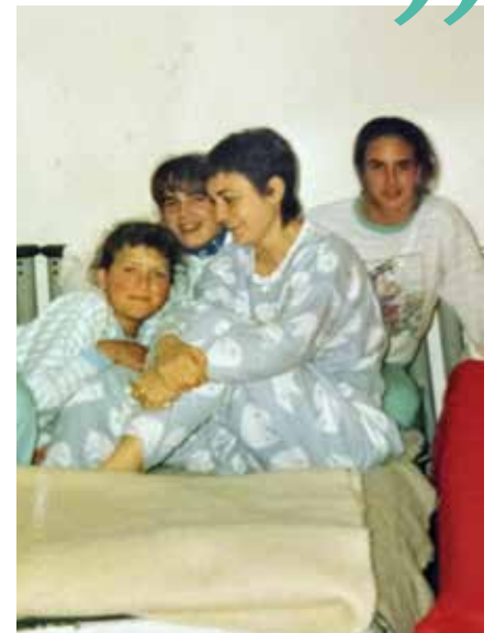
Irurtzungo ikasleekin, irtenaldi batean ▲

“ Lanbide honetan egokitzen joan behar duzu egunero, bestela atzean gelditzen zara, etengabe prestatu behar zara ”