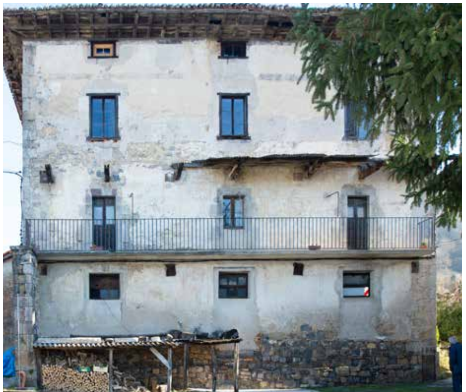
Azpikoaldeko fatxada. Hau du hobekien gorde dena, baina hor ageri dira leiho berrituak, ate tapatuak eta abar. Balkoi erori bat, bestea porlanez berreraikia, etxeko larrainera zituen eskalera ederrak desagertuak...

Aipagarri iduritzen zaigu, komunarena. Jauregi hauek komuna izaten zuten, eta honetan, ur zikinak etxetik ateratzeko ubidea oraingo jabeek obretan ari zirela opatu zuten, harri landuz ederki egin. Bai, etxe galanta izan zen hau, eta oraindik ere hor ditu hainbat elementu arkitektoniko eder.