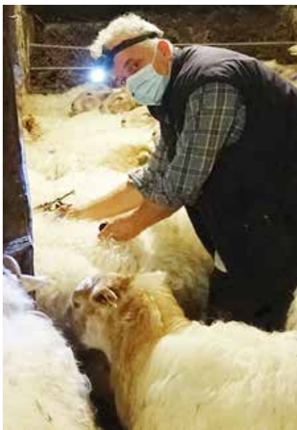
Mingain urdinaren txertoaren inguruan hausnarketa partekatu dute Nafarroako hainbat abeltzainek ▲

Joan den urtean kasu bat azaldu izanagatik erabaki hau modu sistematikoan hartzea gehiegizkoa dela iruditzen zaigu, are okerrago momentu honetan egitea. Alde batetik, negu sarreran, eltxo gutxien dagoen garaian egiten delako, beraz, transmisiorako arrisku gutxien dagoen garaian. Eta, bestetik, azienda erditzen ari denean edo erditzekotan denean jartzen delako, horrek eragiten dituen ondorioekin: aziendak sufritu egiten du, azienda-buru gehienak erabat gortuta gelditzen dira gutxienez hiru egunetan eta kasu batzuetan umatzeak aurreratzea ere ekartzen du.