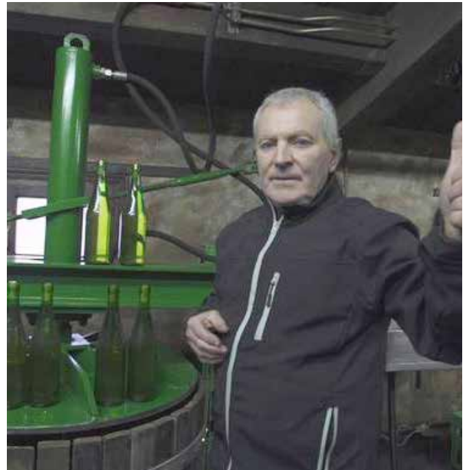
la bi urte eman ditu itxita Txaseneko sagardotegiak ▲

Maiatzaren 1ean bukatuko da aurtengo sagardo denboraldia, baina aurtengo egoera dela eta, ikusiko dute Txaseneakoa zertxobait luzatu edo ez.