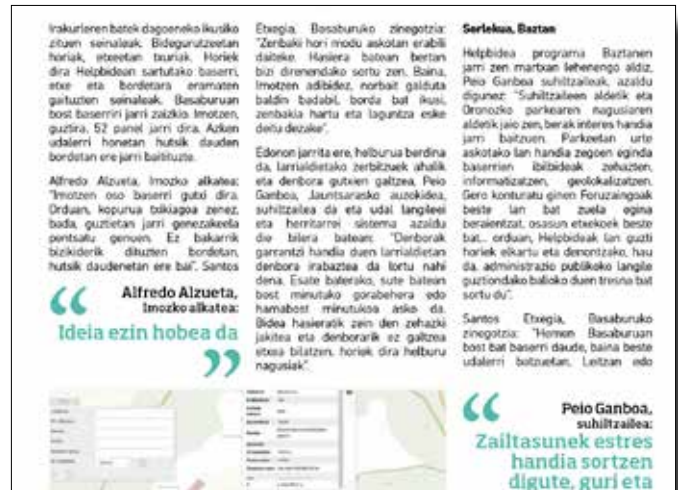
Helpbidearen erreportajearen irudia