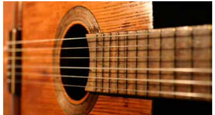
Otsailaren 21a arte eman dezakete izena gitarra ikasi nahi dutenek ▲

asmoa dutenek, otsailaren 21a baino lehen egin beharko dute.