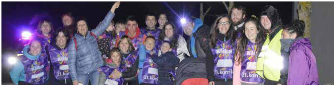
Korrika Erbitin ▲

Korrika igaroko den eguna eta Korrika kulturala antolatzen hasteko, martxan jarri dituzte honezkero eskualdeko Korrika Batzordeak. Imotz eta Basaburuakoa hasi zen biltzen lehenik, eta Ultzama aldekoa gero. Bultzatzaileek dei egin diete herritarrei Batzorde horietan parte hartzeko.