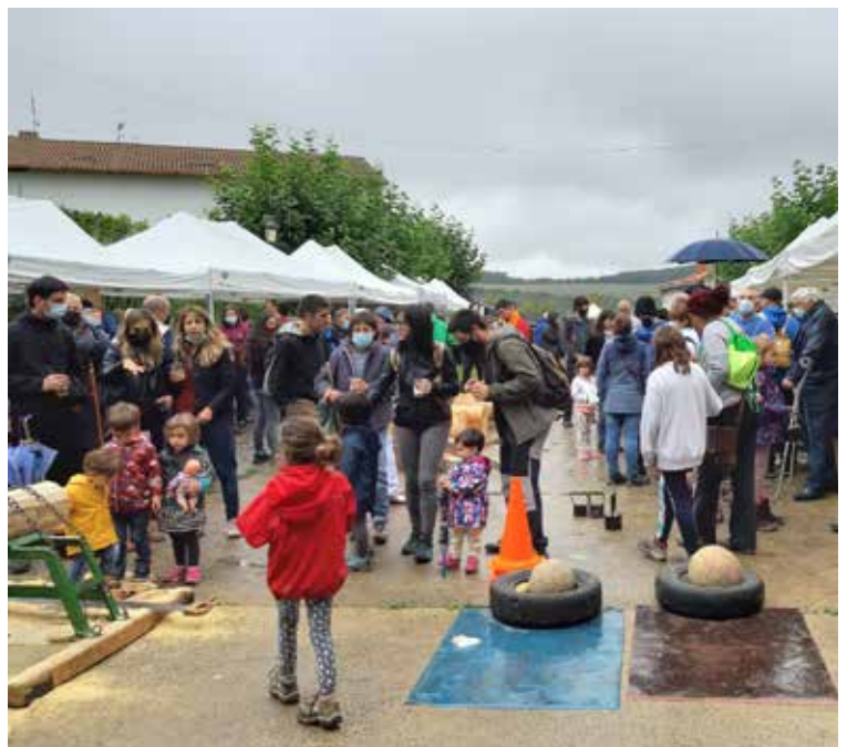
Azoka Ibiltaria Beuntzan, Atetzen, irailean ▲

Horregatik guztiagatik, aurten berriz izanen dugu azoka, antolatzen hasteko urtarrilaren 11n bildu zen talde eragilea. Apirilaren 24n, Araitzen izanen da lehena. Eta, gure eskualdean, apuntatu datak: Uztailaren 3an eta 24an Imoztik eta Basaburutik igaroko da, eta irailaren 4an Ateztik. Hain zuzen ere, Atezkua izanen da azken data. "Postuez aparte hainbat tailer antolatzea planteatu dugu noizbait. Aurten Habelarteren aurkezpena izan da -eskualdean sortu berri den nekazarien elkarte, oinarri agroekologikoa duena-, baina heldu den urtera begira, beste tailer eta aurkezpenak izatea baliteke".