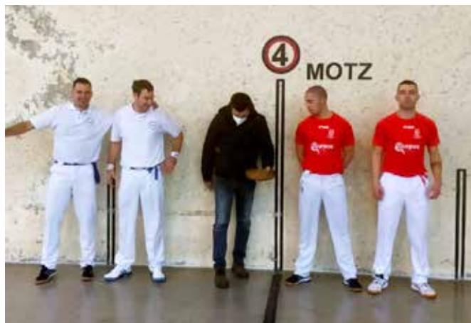
Ilbeltzarek 29an jokatu ziren txapelketako finalak Gartzaronen ▲

Behin Pilota Goxoa txapelketa amaituta eta aurreko urteetako dinamika jarraituz, frontenis eta pala txapelketa izanen dira hurrengoak.