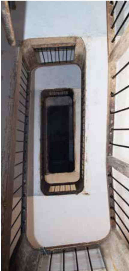
▲ Barneko eskalera, behetik gora fotografatua