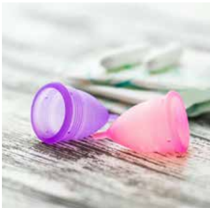
▲ Duela hamarkada pasatxotik hileroko kopak erabiltzeko aukera zabaldua dago gure artean

Azkeneko mende erdian, Mendebaldeko jendartean gure eguneroko bizitzarako ezinbestekoak bihurtu diren "behin erabili eta bota" motako