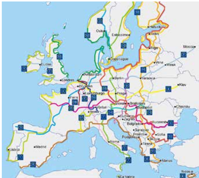
▲ Eurovelo mapa