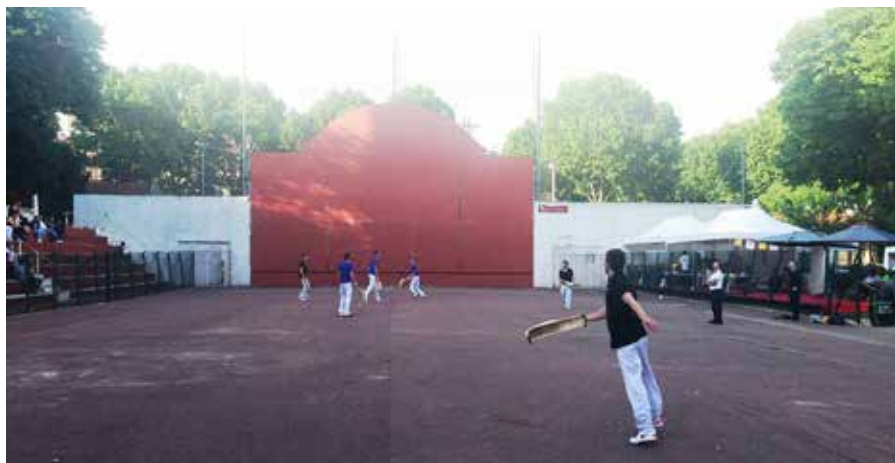
Parisko Fronton Place Libre.

“ Lanaren inguruan jaso ditudan komentarioan onak izan dira, baina saria ez duzu espero ”