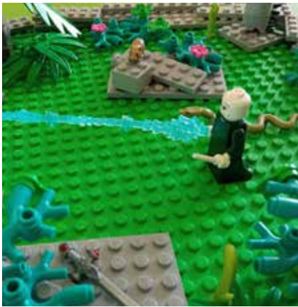
▲ Harry Potterren lego tailerra izanen da irailaren 17an

Irailaren 17an umeendako txanda da. Ordu eta erdiko tailerrak antolatu ditugu Lego piezekin, 5 eta 12 urte bitartekoentzat. Bi tailer dira: bata, dinosauroekin;