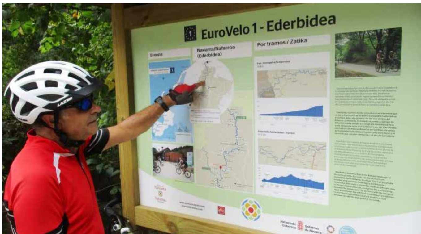
Eurovelo 1 - Ederbidea pasatzen da gure eskualdetik ▲

Proiektua Europako diru-laguntzekin garatzen ari da, eta, bertan, Gipuzkoa, Lapurdi eta Nafarroako administrazio nagusiek eta hainbat elkartek parte hartzen dute. Baztan-Bidasoa bidearen erditik, Doneztebetik, adar bat dator gurera. Imotzen, gainera, adar horrek topo egiten du Baiona-Donostiatik abiatzen den adarrarekin, horrela, Plazaola trenbidearen ibilbidea zeharkatuko du. Hortik, Irurtzun eta gero Iruñeraino. Atlantikoko ibilbidearen zatitxo horrek Portugaleraino izanen du bere jarraibidea eta helmuga.