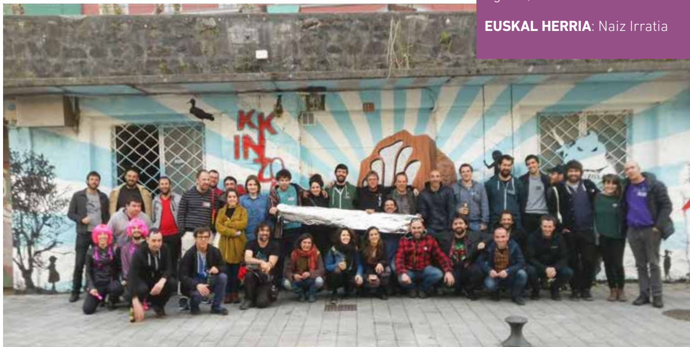
▲ Arrosa topaketak 2019an, Urretxuko KKinzonan