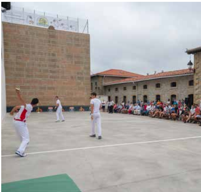
▲ Antiguako txapelketa Larraitzarren

Abuztuaren 10ean abiatu zen Donostiako Antiguako Pilota Txapelketa. Eta, Nafarroako eskupilota eta Larraitzarko frontoia eta pilota omentzeko, bertatik eman zioten hasiera txapelketari.