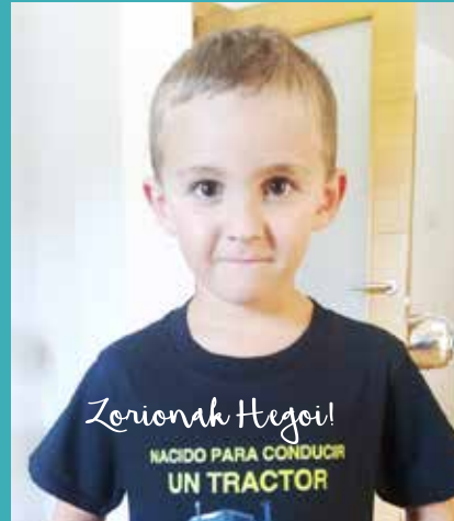
Zorionak Hegoi! NACIDO PARA CONDUCIR UN TRACTOR