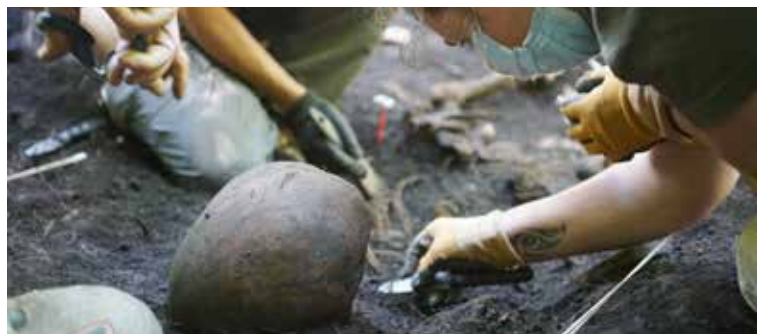
Goldaratzten pasa den urtean aurkitutako gorpuzkien irudia ▲

Hain zuzen ere, bi gorpuzki atera zituzten Goldaratzten pasa zen urteko uztailaren bukaeran. Han ere gehiago daudela uste dute, eta bilaketa gehiago egin nahi dituzte aurrerago. Horretarako lanean ari dira, eta ikasturte berriarekin informazio gehiago eman ahalko digute.