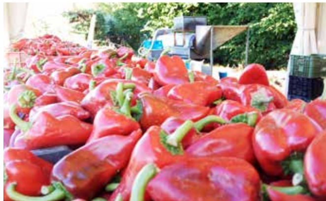
▲ Piperrak erretzeko prest

Bereizgarrienak, beharbada, haien labeetan prestatutakoak dira, erre kutsua baitute. Baina badituzte ere, poteetan sartzekoak (piper beteak egiteko aproposagoak), esate baterako.