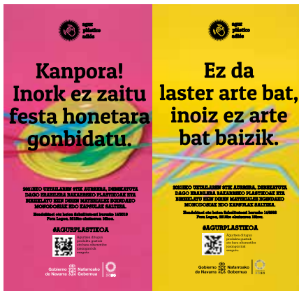
▲ Plastikoen kontrako kanpaina kartelak

Sarritan bide okerra hartzen dugu bizitzan. Orduan, gelditu, bide hori atzean utzi eta bide berria aukeratu behar dugu. Hala ere, maiz, ibilbide ezberdinetatik ailegatu gaitezke helmugara, "bide guztiek Erromara daramate" esan ohi da horrelakoetan.