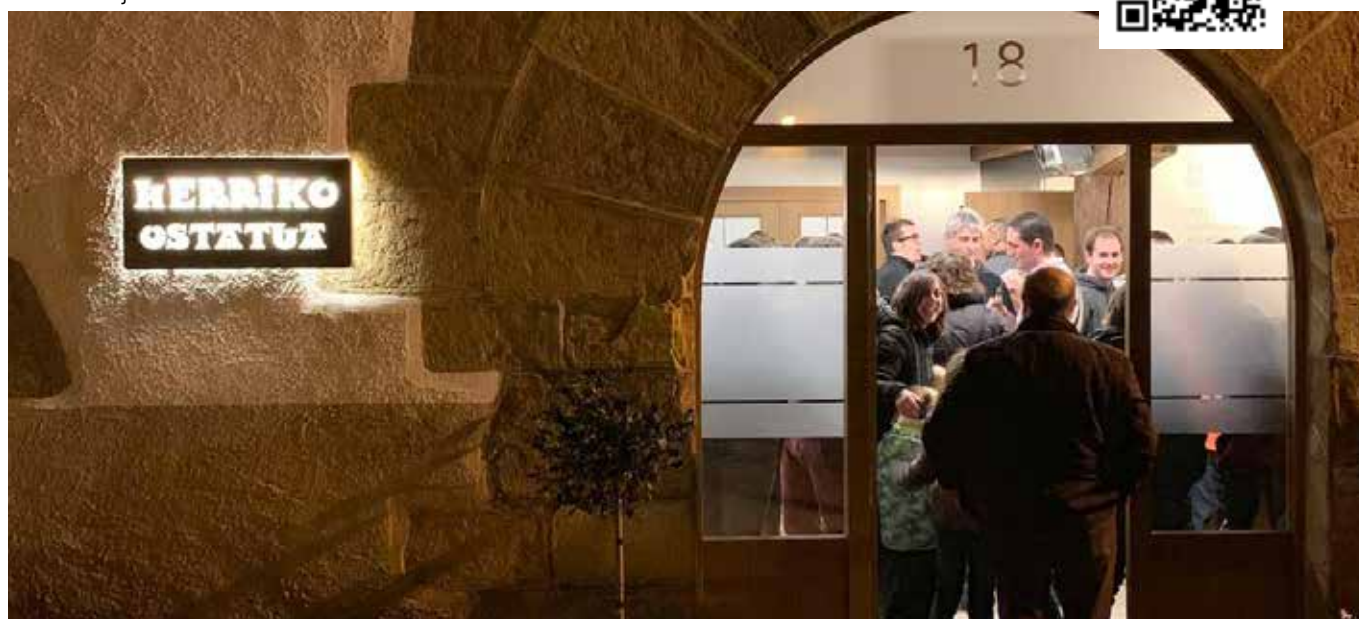
Iraizozko ostataua ▲