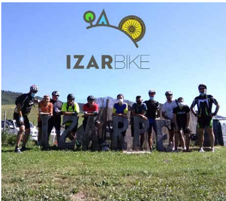
Adin eta kirol maila ezberdineko jendea batu da udako ateraldietara

Maila ezberdineko ibilbideak egin ditugu: egun batean 17 kilometrokoa, beste batean 30... Egunean gauden jendearen arabera aldatuz doa ibilbidearen zailtasuna ere. Ez gara talde bereziki gogor horietakoa, forma fisiko ezberdina dugu guztiok ere, eta jendearekin elkartzeko eta gustura ibiltzeko antolatzen ditugu ateraldiak. Beraz, geldialdiak egiten ditugu ibilbidean zehar denak elkartzeko eta norbait atzean gelditu bada lasai itxoiteko. Gainera, kanpinean bizikleta elektrikoak ere badira alokairuan, eta aukera hori ere badago: ibilbidea gogorra bada egunen batean, bizikleta elektrikoak alokatzekoa.