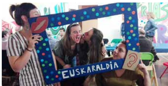
Duela bi urteko euskaraldia kanpaina ▲

Parte-hartzaile bakoitzak rol bakarra hartu behar du, eta izena ematen duten guztiei identifikatzeko txapa banatuko zaie, azaroaren 20a baino lehen. Arigune gisa izena emateko epea irailaren 27an bukatu zen, eta irailaren 24an hasi zen norbanakoek izena ematekoa. Beraz, lehenbailehen izena eman euskaraldia.eus helbidean edo 948305134 telefonora deituz.