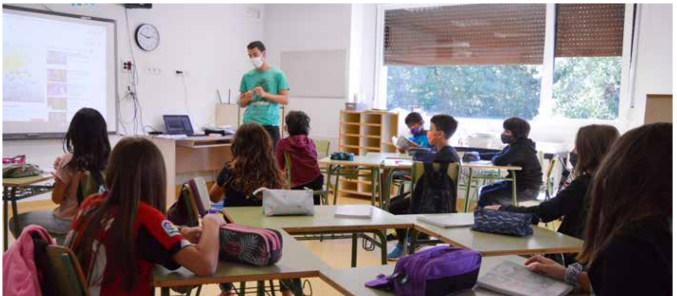
Oihanzabal eskolako ikasgela bat, aurtentzen

Gauzak horrela, aurrera doa gure zonaldean ikasturtea eskoletan. Dena ongi joanez gero ez da behar izanen aurreikusitako beste planik ezartzea, baina badaezpada ere, lanean dihardute aukera horretan ere.