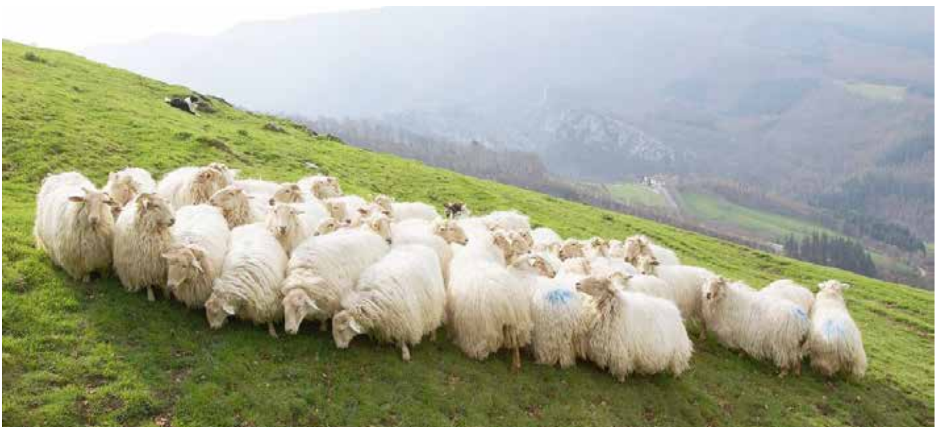
Latxa artalde bat mendian ▲

Paradoxa badirudi ere, lehen gai ekologiko honek ez du berrerabilia izateko irtenbide erraza. Produktu honek, gaur egungo produktu erakargarri baten baldintza guztiak betetzen ditu: lehengai ekologikoa da, gurea, kilometro Okoa, oso ugaria eta ustiatzeko ez da zaila eta gainera ustiatzeko prozesua ez da inolaz kontaminatzailea. Baldintza ia guztiak betetzen ditu, bat izan ezik: ez du merkaturik.