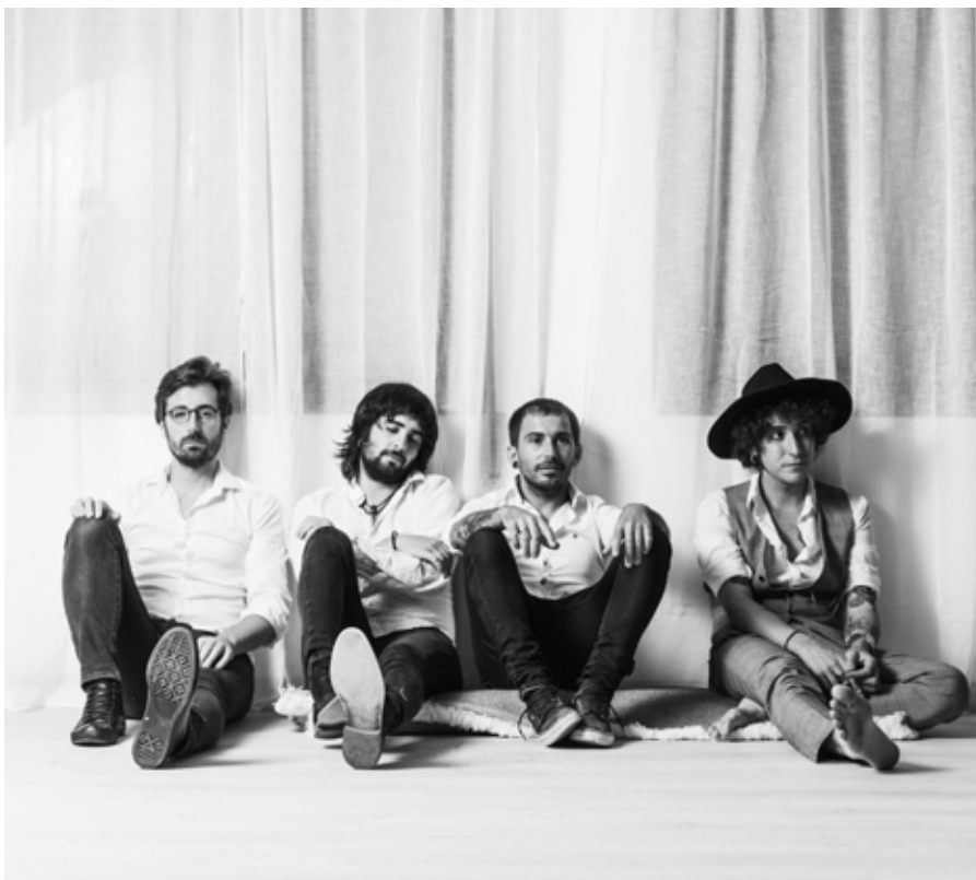
▲ Con X de Banjo