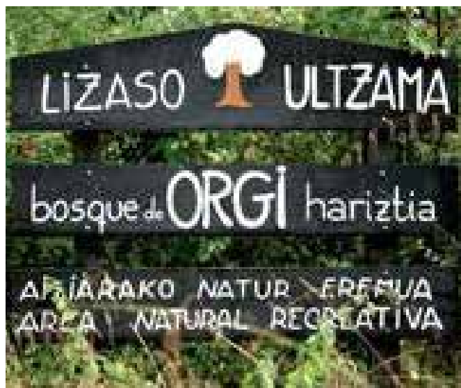
Orgi basoa ▲

Hemendik aurrera badituzte beste proiektu eta erronkak. Urrian, ipuin kontalariekin jarraituko dute, baina, udan ez bezala denak euskaraz izango dira. Ostiral arratsaldetan, larunbat goizetan eta arratsaldetan eta igande goizetan izanen dira, guztira 15 saio. Posible bada Orgi basoan, baina eguraldiak laguntzen ez badu, Barraskilo proiektuan edo Lizasoko pilotalekuan izango dira. Ahozko kontu kontalariak oso garrantzitsuak izan dira gure kulturaren, gure baserrietan eta ohitura hori ez dutela galdu nahi esan digute Orgi Basoko kudeatzaileek.