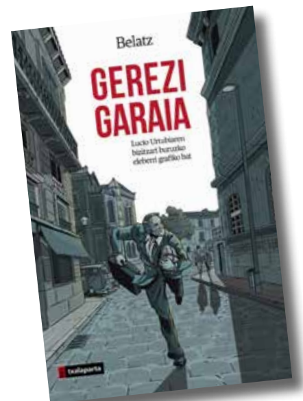
Gerezi Garaia, Lucio Urtubiari buruzko komikiaren azala