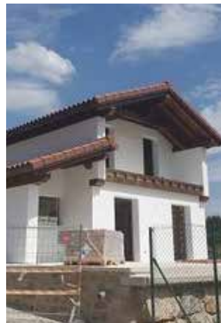
▲ Olaguen eraikitzen ari diren etxebizitza

behar izan duena ez zuelako ezer eraikitzeke edo zaharberritzeke. Niri pena handia ematen dit. Bestalde, jende askok beste herri batzuetara joan behar izan du, Auzan edo Orkinen dauden pisuetara, adibidez, bere herrian ez baitzegoen eskaintzarik”.