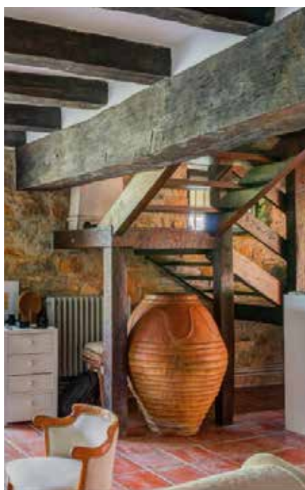
▲ Inmobiliaria Navarrak Imotzen saltzen duen etxea