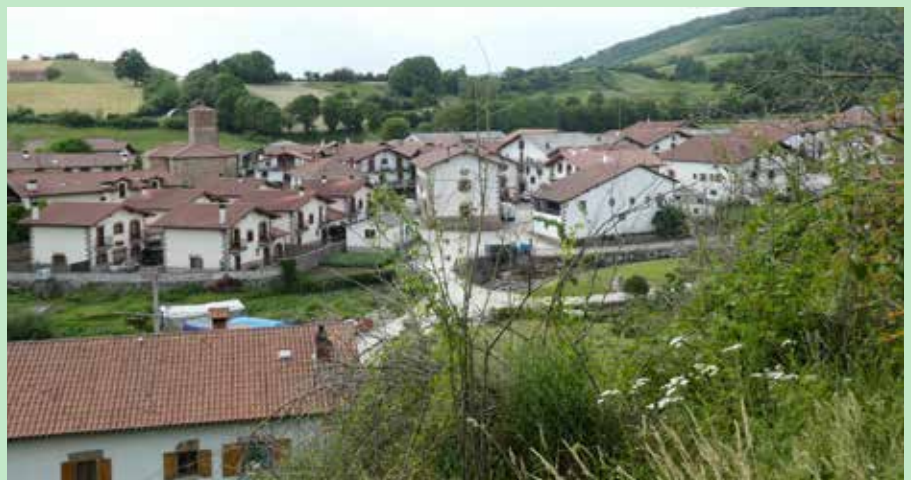
Lanzko herria, Aritzu aldetik