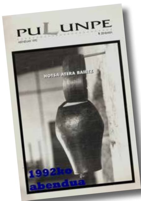
Lehenengo Pulunperen azala ▲

Gogoan dut ilusio handia genuela. Lehendabiziko zenbakia batez ere AEKren bueltako jendeak bultzatu zuen. Euskaltegia zegoen Iraizotzen, eta lehendabiziko bilerak han egiten genituen. 12 bat laguneko taldetxoak elkartzen ginen. 1992ko abenduan atera zen lehen alea, baina maiatzaren inguruan hasi ginen lanean. Aldizkaria atera zenean ez genuen ia sinistu ere egiten lortu genuela, guk ez baikenekien kazetaritzaz, informatika aldetik ere ez genuen ja kontrolatzen, argazkilaritza ere ez zen orain bezala... Poliki-poliki ikasten eta martxa hartzen joan ginen.