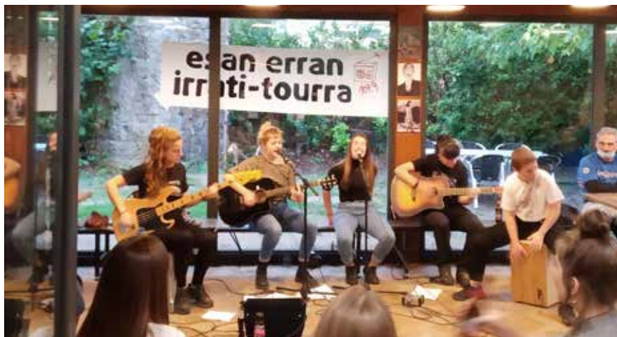
Kontzertu akustikoa jo zuen Leizeak taldeak Esan Erraneko irratiri biran ▲