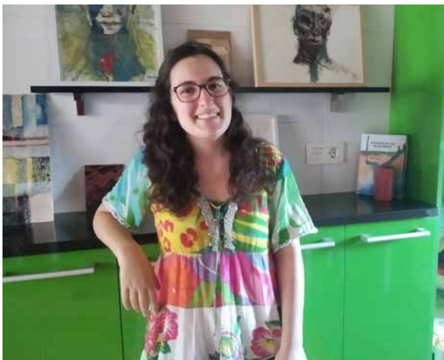
Disziplina asko uztartzen ditu Galarrek bere lanetan ▲

Kanpokoak sorrarazten didan kaosaren aurrean babesleku bat da artea niretzat. Nire bizitza da hau. Bestalde, karreraren eskulturarekin eta abstraktuarekin lanean ari nintzenean, pena handia ematen zidan nire gurasoek egiten nuena ez ulertzea: egiten nuena herritarragoa izatea nahi nuen, edonork ulertzeko modukoa izatea. Diziplina ezberdinetan horretan ari naiz. Dena dela, beti saiatzen naiz esanahi irekiko gauzak egiten.