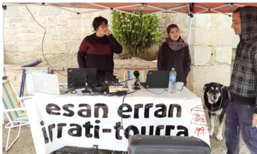
Sekulako euri zaparrada bota zuen Erripan ▲