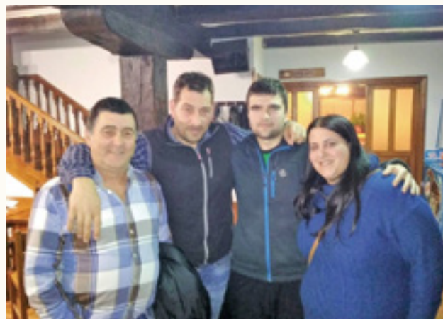
Ultzamako ordezkariak Nafarroako txapelketarako