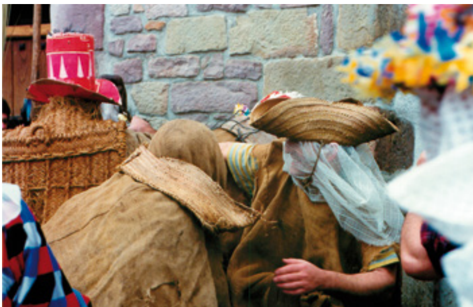
Zaldiko, ziripoten kontra erasoan

Eta konformatu liteke Zaldiko sexuaren aurreko ferratzearekin, zeren kasu Zamaltzaini gertatzen zaionarekin Violeta Alfor folkloristak dioenari arabera! "Erritu pantomimetan osatzaile