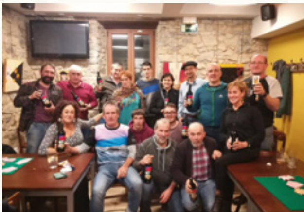
Jauntsaratsen parte hartu zuten guztiak

Sari ederrak dituzte zain parte-hartzaileak, irabazleak txapelaz gain 3.000 euroko saria eta Karibera bidaia bat irabaziko baitu! Gainera, halakoak ez izan arren, denendako sariak egonen dira.