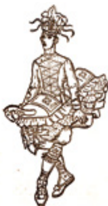
Zamaltzain, Zuberoako zaldikoa

Kontuz honi! Gizonaren oinarrizko beharrak ez dira beti gizarte usadiorekin bat izten, Europako iparraldean ez bada behintzat, diotenez. Honetan ere europarrak gara, baina oraindik ez gara suediarrek. Hortik pastoraletako osatzeraino... baina hobea izanzen da irrikik ez egitea, zenbait gauza aipatzea ere ez baita komeni izaten.