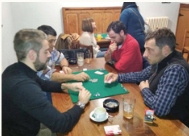
Iraizotzko kanporaketako momentu bat