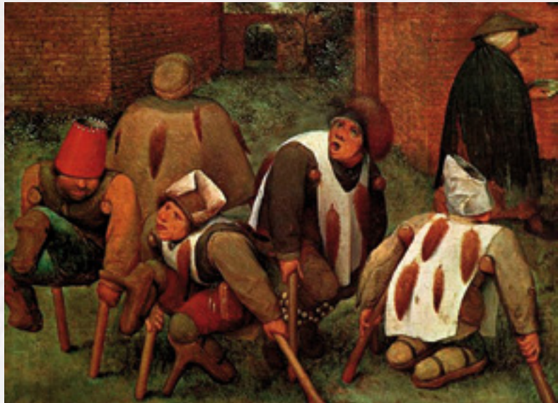
Pieter Bruegel Zaharra (1525-1569) deitzen den pintorearen koadroa, Eskaleak deitua. Orain bi hilabete atera genuen hau bera, baina ez genuen norena zen jarri. Huts egite handia. Orain berreskuratu dugu, gaurkoan ere eskaleak ateratzen baitzaizkigu artikuluan eta horrela zorra ordainduta gelditzen da.

Nire bizitza guztian ez diot horrelakorik inoiz inori erran. Animatu bai euskaraz ikastera ia egunero. Baina horrela iraindu aldamenekoa? Ez, ez. Bertze esaera bat ere bada aunitzetan entzuten dudana: ¡Qué verguenza que siendo de (Ultzama...) no sepais euskara! Hizkuntza bat ikastea aitagurea ikastea balitz bezala. Eta hori erraten dutenak, ia denak, denak ez esatearren, analfabetoak dira, ez dakite irakurtzen eta idazten. Bertzei neurriak jarri, berendako dena libre. Ai, gure hizkuntza gaixoa, horrelako "adiskideekin"