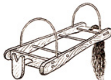
ARMAZÓN DEL XALDIKO DE LANZKO