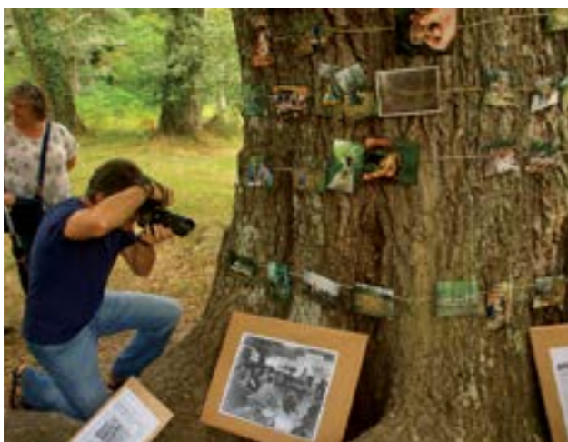
Oroitzapenen haritzaren eta Txari Eletaren kontzertuaren argazkiak.

Uztailaren 30 eta 31ko asteburuan Orgi Basoa Aisiarako Natur gune izendatzearen XX. urteurrena ospatu zen. "Ultzamako eta Basaburuko Hariztiak" izeneko Zainketa Bereziko Eremuan sarturik dagoen gune babestu honek inaugurazio egunetik beretik bere hiru helburuak betetzen ditu, hau da, basoa kontserbatzea, ingurumeneko heziketa eta aisiarako erabilera. Urtero 40.000 lagunek bisitatzen dute basoa.