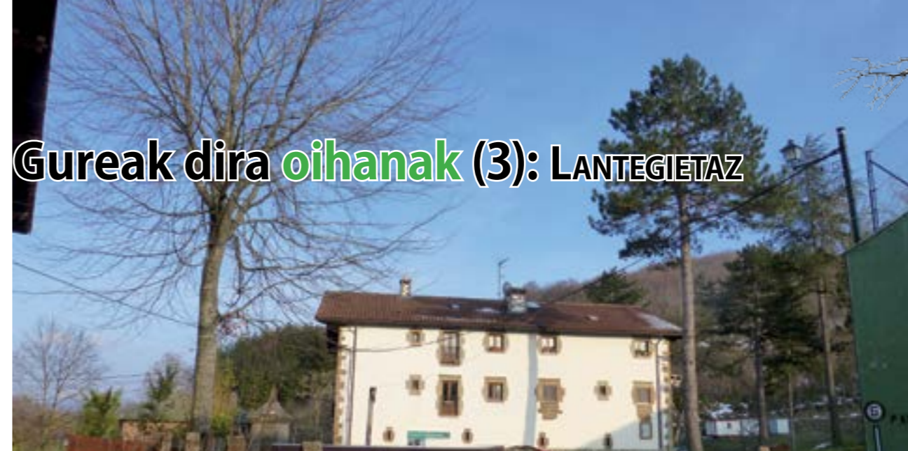
Erbetiko Etxebertzea eta bi arbola ederrak: pinua, 1939. urtean landatua. Ezkerrera pagoa, aise gazteagoa