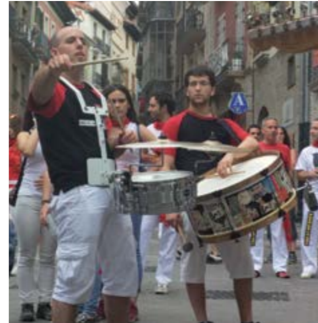
Urritzolako Aritz eta Suarbeko "Patta" talde honen partaide dira. Bitxikeria bezala, biek instrumentu berbera jotzen dute, kutxa. Kalean ordu luzez jotzen dutenez, txandakatzen dira.

Nola pasatzen den denbora. Hamar urte jada. Elektrotxaranga 10 urte bete ditu aurten, eta sanferminetan ospatu zuten. Baina zer da, bada, elektrotxaranga?