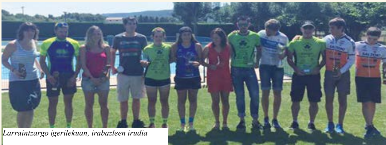
Larraitzargo igerilekuan, irabazleen irudia

A urtengo abuztuaren 15ean, urtero bezala, Ultzamako kross triatloia izan genuen. Hemeretzi ekitaldi izan ditugu jada, eta beti bezala giro ezin hobea izan zen aurten ere. Aurtengo lasterketa astelehenean izanda, pentsatzekoa da jende askok asteburu luze hori kanpora joateko probestu zuela, eta parte hartzea ez zen handiegia izan. Dena den, 22 kirolari aritu ziren